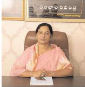
అయితే దీనిపై మాజీ మంత్రి పరిటాల సునీత తీవ్రంగా స్పందించారు. ప్రతి రెండు మూడు నెలలకు ఒకసారి వచ్చి ఫేక్ పట్టాలిచ్చాము.

ఎన్నిసార్లు చెప్పిందే చెబుతావ్, ప్రభుత్వం మీది, అధికారులు మీ చేతుల్లో ఉన్నారు. భూ ఆక్రమాలు జరిగి ఉంటే విచారణ చేయించు అంటూ మాజీ మంత్రి పరిటాల సునీత రాష్ట్రాడు ఎమ్మెల్యే ప్రకాష్ రెడ్డి పై పైర్ అయ్యారు. ఆనంతపురం రూరల్ పరిధిలోని ఉప్పరపల్లి, కురుగుంట, రావానపల్లి, సోములదొడ్డి, ఇటుకలపల్లి, అక్కంపల్లి, కొడిమి పాలాల్లోని సర్వే సంబంధంలో టీడీపీ వారుంటే తేలాది మందికి ఫేక్ పట్టాలిచ్చారని ఆరోపిస్తున్నారు. ఇదే అంశం మీద త్వరితగతిన విజిలెన్స్ అధికారులతో విచారణ చేయించాలని జిల్లా కలెక్టర్ ను కలసి ఫిర్యాదు చేశారు. సీఎం జగన్ దృష్టికి కూడా తీసుకెళ్లినట్టు చెప్పుకుంటున్నారు.