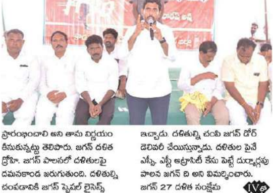
ప్రారంభించాలి అని తాను నిర్ణయం తీసుకున్నట్లు తెలిపారు. జగన్ దళిత డ్రోహి. జగన్ పాలనలో దళితులపై దమనకాండ జరుగుతుంది. దళితుల్ని చంపడానికి జగన్ స్పెషల్ లైసెన్స్ ఇచ్చాడు. దళితుల్ని చంపి జగన్ డోర్ డెలివరీ చేయనున్నాడు. దళితుల పైనే ఎస్సీ, ఎస్టీ అట్రాసిటీ కేసు పెట్టే దుర్మార్గపు పాలన జగన్ బి అని విమర్శించారు. జగన్ 27 దళిత సంక్షేమ

నారా లోకేష్ వాల్చారు. ఈ సందర్భంగా దళిత సంఘాల ప్రతినిధులు ఆడిగిన పలు ప్రశ్నలకు లోకేష్ సమాధానం చెప్పారు. టిడిపి అధికారంలోకి వచ్చిన వెంటనే మరింత పటిష్టంగా ఎస్సీ, ఎస్టీ అట్రాసిటీ చట్టాన్ని అమలు చేస్తామని లోకేష్ చెప్పారు. మంత్రిగా ఉన్నప్పుడు ఎస్సీ కాలనీల నుండే అభివృద్ధి కార్యక్రమాలు