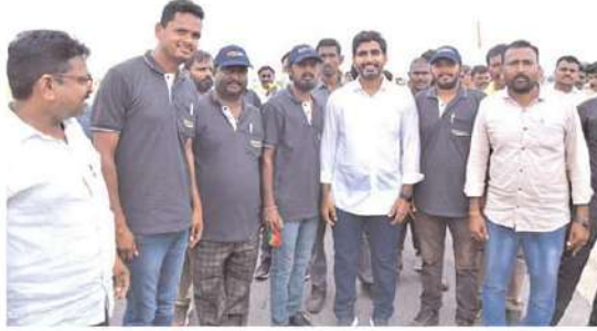
దళిత ద్రోహి జగన్ రెడ్డి, 27 ఎస్సీ సంక్షేమ పథకాలను రద్దుచేసి దళితులకు తీరని అన్యాయం చేశారు. అధికారంలోకి వచ్చాక వాటన్నింటినీ పునరుద్ధరిస్తాం. టెన్స్ అన్లైబుల్ స్కూల్స్ అందేదర్ల స్టడీ సర్కిల్స్ లను రద్దుచేసిన వైసిపి ప్రభుత్వం పేద ఎస్సీలను విద్య, ఉద్యోగాలకు దూరం చేశారు. టిడిపి అధికారంలోకి వచ్చాక రాయలసీమలో ప్రాజెక్టులను పూర్తిచేసి వలసలను నివారిస్తాం. మూడుగల సామాజిక న్యాయానికి కట్టుబడి ఉన్నామని లోకేష్ హామీ ఇచ్చారు.

ఎస్సీలకు గత ప్రభుత్వం అనుబంధించిన 27 సంక్షేమ పథకాలను పునరుద్ధరించాలి. కర్నూలు జిల్లా పశ్చిమ ప్రాంతమైన ఆదోని డివిజన్ లో వేసవికాలంలో వలసలు ఎక్కువగా ఉన్నాయి. గండ్లపాలెం, వేదాపతి, గురు రాఘవేంద్ర ప్రాంతాల్లో పూర్తిస్థాయిలో చేపట్టి వలసలను నివారించాలి. టిడిపి అధికారంలోకి వచ్చాక ఎస్సీ వర్గీకరణను అమలు చేయాలి. అమరావతి రాజధానిలో 125 ఆడుగుల అందేదర్ల విగ్రహంతోపాటు బాబూ జగజ్జీవన్ రామ్ విగ్రహాన్ని ఏర్పాటు చేయాలి అని వారు విజ్ఞప్తి చేశారు. వారి సమస్యలపై నారా లోకేష్ సానుకూలంగా స్పందించారు. అధికారంలోకి వచ్చాక రూ.28,147 కోట్ల సబ్ ప్లాన్ నిధులను దారిమళ్లించిన