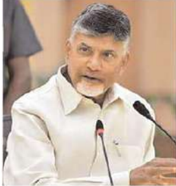
రాష్ట్రంలో గత పది రోజులుగా కురుస్తున్న అకాల వర్షాలతో 4 లక్షల ఎకరాల్లో పంటలు దెబ్బతిన్నాయి. వర్షాలపై ముందస్తు సహచారం. తగు ఏర్పాట్లు ప్రభుత్వం చేయకపోవడంతో రైతులు ఎక్కువగా నష్టపోయారు. ఏప్రిల్ 23

రాష్ట్రంలో కురుస్తున్న అకాల వర్షాలతో అన్నదాతలు తీవ్రంగా నష్టపోతున్నారని అందంగా నిలవడంలో జగన్ రెడ్డి విఫలమయ్యారని టిడిపి అభినేత నారా చంద్రబాబునాయుడు మండిపడ్డారు. పార్టీ ముఖ్యనేతలతో బుధవారం నిర్వహించిన టెలికాన్ఫరెన్స్ లో అకాలు వర్షాలు, పంట నష్టం, రైతులను ఆదుకోవడంపై చంద్రబాబు పార్టీ శ్రేణులకు దిశానిర్దేశం చేశారు. రాష్ట్రవ్యాప్తంగా కష్టాల్లో ఉన్న అన్నదాతలకు అందగా నిలవాలని పార్టీ శ్రేణులు పిలుపునిచ్చారు. 4.5 తేబీలలో ముంపు ప్రాంతాల్లో చంద్రబాబు పర్యటించి రైతులకు భరోసా ఇవ్వనున్నారు. ఈ సందర్భంగా చంద్రబాబునాయుడు మాట్లాడుతూ