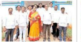
పల్నాడు జిల్లా కలెక్టర్, ఎస్పీని కలిసిన దీడీపీ నేతలు