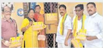
ఇంటింటికీ తిరిగి సమస్యలు తెలుసుకున్న దీడీపీ నాయకులు