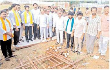
భూమిపూజ చేస్తున్న దీడీపీ నేతలు