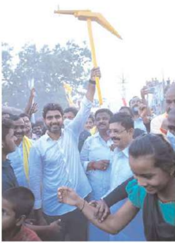
అధికారంలోకి వచ్చిన వెంటనే ప్రతి ఏడాది నోటిఫికేషన్ ఇస్తాం. జగన్ విశాఖ, అనంతపురం, గుంటూరు లో మూసేసిన స్టడీ సర్టిఫైడ్ లింగ్ ప్రారంభించడంతో పాటు అన్న జాబ్ లో స్టడీ సర్టిఫైడ్ ఏర్పాటు చేస్తుమని హామీ ఇవ్వారు.

మహిళల తాళబట్టు తెంచుతున్న జైలు జగన్ జైలు జగన్ మహిళల తాళబట్టు తెంచేస్తున్నాడు. మద్యపాన నిషేధం తరువాత ఒట్లు అడుగుతా అన్నాడు. ఇప్పుడు మద్యాన్ని ఏదైతే పాలిస్తున్నాడు అని ఆవేదన వ్యక్తం చేశారు. మహిళల తాళబట్టు తాళబట్టు పెట్టి 25వేల కోట్లు అప్పు తెచ్చాడు. 45 ఏళ్లకే జీన్, ఎస్సీ, ఎస్టీ మహిళలకు పెన్షన్ అన్నాడు. పెన్షన్ రేపుడెరుగు పాపం మహిళల దాచుకున్న అభయమాపుం డబ్బులు 2500 కోట్లు కొట్టేసాడు. ఎంత మంది పిల్లలు ఉంటే అంతమందికి అమ్మ ఒడి ఇస్తా అని మోసం చేసాడు. టిడిపి అధికారంలోకి వచ్చాకా పన్నుల భారం తగ్గిస్తాం. నిత్యావసర సదుకుల ధరలు తగ్గిస్తాం. రైతు రాజ్యం తెస్తానన్న జైలు జగన్ రైతులు లేని రాజ్యం తెస్తున్నాడు. జైలు జగన్ పలవాలనలో పురుగుల మందులు పనిచేయవు. జగన్ ట్రాండ్లు మైసికెంట్ మెడల్, గోల్డ్ మెడల్, ఆంధ్రా గోల్డ్ కోడికే మాత్రం పురుగులు చస్తాయి. రైతుల్ని ఆదుకోకపోగా ఇప్పుడు మీటర్లు పెడుతున్నాడు. రాయలసీమ లో 1000 అడుగుల వరకూ బోర్లు వేస్తే కానీ నీళ్లు రావు...మరి కరెంటు బిల్లు ఎంత వస్తుందో