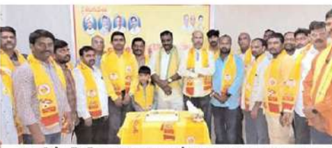
కువైట్లో ఎన్ఆర్ఐ టిడిపి ఆధ్వర్యంలో చంద్రబాబునాయుడు జన్మదిన వేడుకలు ఘనంగా జరిగాయి

న్యూయార్క్ - ఆన్లైన్ మీడియా అవుట్లెట్ బజ్జీఫీడ్ సంస్థ ఉద్యోగుల్లో కోత విధిస్తున్నట్లు ప్రకటించింది. ఖర్చులు తగ్గించుకునేందుకు, మూలధనాన్ని ఆదా చేసే ప్రయత్నాల్లో భాగంగా 15 శాతం ఉద్యోగులకు ఉద్యోగం చెబుతున్నట్లు కంపెనీ షీప్ ఎగ్జిక్యూటివ్ బోనా పెరెర్రె గురువారం సిబ్బందికి పంపిన ఆమెయిల్లో తెలిపారు. అలాగే కంపెనీ వార్తా విభాగాన్ని కూడా మూసివేస్తున్నామని ప్రకటించారు. తొలిగింపులు కంపెనీ కంటింటి, అడ్మినిస్ట్రేషన్, జిజినెస్, విక్రాలజీ డీమల్లో దాదాపు 180 మంది ఉద్యోగులపై ప్రభావం ఉంటుంది. ఐదు నెలల్లో ఇది రెండవ రౌండ్ తొలిగింపులు. డిసెంబర్లో కంపెనీ తన ఉద్యోగులను 12 శాతం తగ్గించే ప్రకాశించింది. కంపెనీ తన 2023 ఆర్థిక సంవత్సరం రెండో త్రైమాసికం చివరి నాటికి తన ఉద్యోగుల తగ్గింపును పూర్తి చేయాలని భావిస్తోంది. 2006లో స్థాపించిన న్యూయార్క్ ప్రధాన కార్యాలయం కలిగిన బజ్జీఫీడ్ డిజిటల్ మీడియాపై దృష్టి సారించే మీడియా, వార్తలు, వినోద సంస్థ.