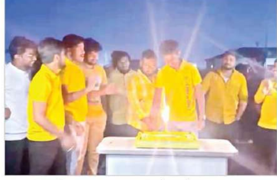
ఉజ్బెకిస్తాన్ లో చంద్రబాబు నాయుడు పుట్టినరోజును కోలాహలంగా జరుపుకున్న మెడిసిన్ విద్యార్థులు