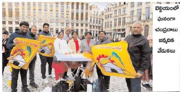
బెర్లియంలో ఘనంగా చంద్రబాబు జన్మదిన వేడుకలు