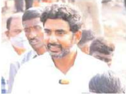
ల్యాండ్ గా ఉన్న భూమిని వ్యవసాయ భూములుగా చూపి తన కుటుంబం పేర లబ్ధిపడన చేయించిన

బెంజి మంత్రి గుమ్మనూరు ఇయారా అవినీతి చిట్టా తెలుగుదేశం పార్టీ జాతీయ ప్రధాన కార్యదర్శి నారా లోకేష్ విడుదల చేశారు. ల్యాండ్ స్కాం కి సంబంధించి ఆధారాలు విడుదల. ప్రభుత్వాన్ని తప్పుదారి పట్టించి భూములు కొట్టేసిన క్రమాన్ని బయటపెడుతూ ఆధారాల విడుదల. 180 ఎకరాల ఇటీవల భూములు కాజీసిన బెంజి మంత్రి కమర్షియల్