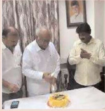
వార్డుమంత్రి భవన్ లో రాజ్యసభ సభ్యులు కనక మేడల రవీంద్ర కుమార్ ఆధ్వర్యంలో చంద్రబాబునాయుడు జన్మినోత్సవ వేడుకలు