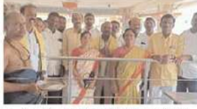
చేశారు, పెద్ద ఎత్తున కార్యకర్తలు నాయకులు పాల్గొని విజయవంతం చేయడం జరిగినది.