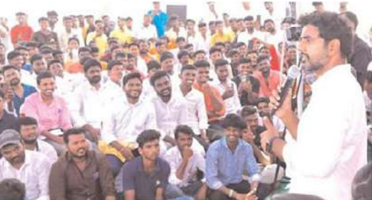
డీపీ అధికారంలోకి వచ్చాక కేజీ టు పీజీ వరకు ఉన్న సబ్సెక్టర్లను మారుస్తాం, విద్యారంగాన్ని ప్రక్షాళన