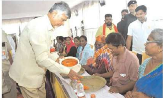
ఎంతముఖ్యమో, కుటుంబంలో ఆడబిడ్డలు కూడా అంతే ఆర్థికవ్యవహారాలు చక్కబెట్టగలరన్నారు.

సంకీర్షించాల్సిన విషయం. నేను ప్రారంభించిన పథకాలు, నిర్మాణాలు వైఎస్ రాజశేఖర్ రెడ్డి కూడా కొనసాగించాడన్నారు. ఇక్కడే