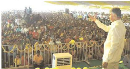
కాలానుగుణ్యంగా నా రెండోసంకల్పం అని చంద్రబాబు నాయుడు వెల్లడించారు. ఆనుభవం, విజన, బెచ్చలజ వాడుకోవ