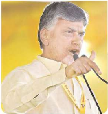
వివేకా హత్యకేసులో సీజన్ రివ్యూ వేగం పెందింది. దీంతో జగనాసుర రక్తచరిత్ర క్షమాక్ష్మి కు చేరుకుంటున్నది. ఈ కేసుకు సంబంధించి కీలకంగా భావిస్తున్న వారిని

తుది దశలో వివేకా హత్య, కోడికత్తి కేసు విచారణలు టిడిపిపై ఆరోపణలు కట్టుకథలే నిందితులు ఆరోపణలే అందుకు సాక్ష్యం ఫేక్ ప్రచారాలపై ఆక్షరక్షణలో పడిన వైసీపీ న్యాయస్థానాల సాక్షిగా బద్దలవుతున్న ఫేక్ బండారం సీజన్ అరెస్ట్ చేస్తుండటం అధికార పార్టీలో కలకలం రెక్కెత్తిస్తోంది. రెపో మాఫో మరొకొన్ని అరెస్టులు జరిగే అవకాశం వుందని ప్రచారం జరుగుతుండటంతో పరువు నిలుపుకు నేందుకు అధికార పార్టీ నానా తంటాలు పడుతున్న సూచనలు కానవస్తున్నాయి. ఈ