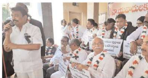
విజయవాడ జిల్లా కోర్టు ఆవరణలో బార్ అసోసియేషన్ సభ్యులు నిరాహారదీక్ష కార్యక్రమం.