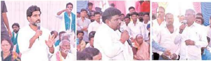
(మొదటిపేజి ఆరువాయి) ఈ ప్రభుత్వం పట్టించుకోలేదు. ఆలూరులో

బీడిపీని ఆదలించండి. వేదావతి, నగరదోని ప్రాజెక్టును మూడేళ్లలో పూర్తి చేస్తాం. ప్రతి ఇంటికి తాగు నీరుందింటింటి బాధ్యత తీసుకుంటాం. టమోటా ధర రోజుకో ఐదంగా మారుతోంది. రూ.3 వేల కోట్లతో ధరల స్థిరీకరణ నిధి ఏర్పాటు చేస్తామని చెప్పాడు. కానీ రైతులకు వచ్చింది క్రాఫ్ పోలీస్ మాత్రమే. కోట్ల స్టాక్ లికేజీతో పంపిణీ చేయలేక రైతులు బాధ పడుతున్నారు. రూ.110 కోట్లతో టమోటా వాల్యూ చెస్ పథకాన్ని గతంలో రూపొందించాం. దాన్ని ఈ ప్రభుత్వం పట్టించుకోలేదు. టమోటాకు గిట్టుబాటు ధర కల్పించే బాధ్యత మేము తీసుకుంటామని లోకేష్ హామీ ఇచ్చారు.