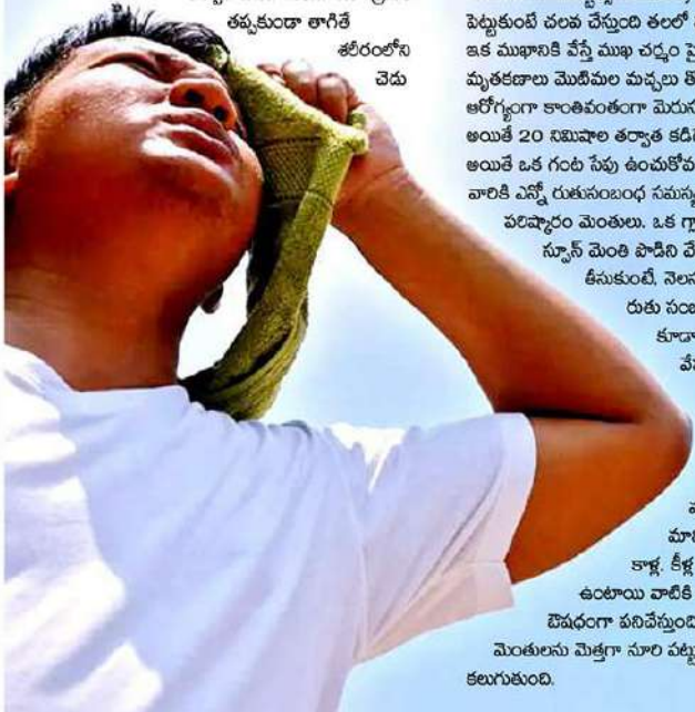
తర్వాత వడపోసుకుని ఇలా క్రమం తప్పకుండా తాగితే శరీరంలోని చెడు

ఎండలు చూస్తే మండిపోతున్నాయి. ఎండల నుంచి చల్లదనం కోసం కొన్ని చిట్కాలను పాటిస్తే వడదెబ్బకు గురికాకుండా ఉండొచ్చు. మెంతులు తినడానికి చేదుగా అనిపించినా చక్కని సువాసన మరెవ్వో ఔషధ గుణాలు కలిగి ఉంటాయి. మెంతులు పౌడర్ చేసి ఒక స్పూన్ మెంతుల పౌడర్ ఒక గ్లాసు గోరువెచ్చని నీళ్లలో వేసి పావు గంట సేపు వక్కని పెట్టేయాలి.