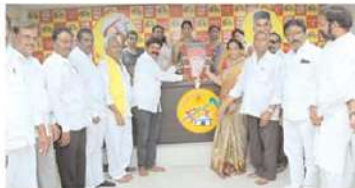
విజయవాడ లోక్ సభ సభ్యుని కార్యాలయం కేబినెట్ భవన్ లో..