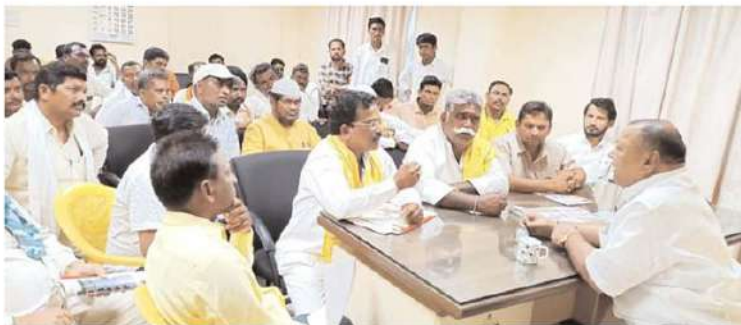
- వివేధాలు వీడి పార్టీ బలోపేతం కోసం కృషి చేయండి - ఎన్టీఆర్ భవన్ లో మురగాలగూడ, జాజ్జీహార్ష నియోజకవర్గ నాయకులతో సమావేశం