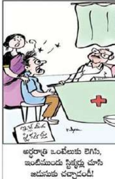
ఆర్ధరాత్రి ఒంటలుకు దిగి, ఇంటిముందు స్విక్టర్లు చూసి జడనుకు చచ్చాడండీ!