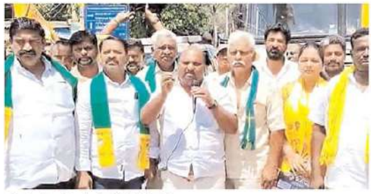
పూలపట్టులో విద్యుత్ సబ్ స్టేషన్ వద్ద