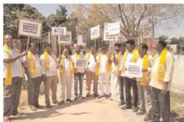
టీ సుండుపల్లె మండలంలో..