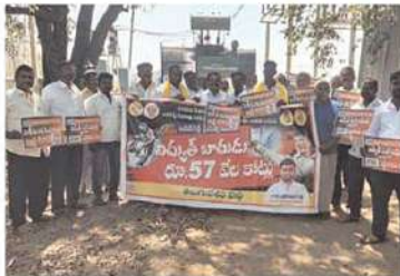
ప్రొద్దుటూరు నియోజకవర్గం లో..

విద్యుత్ ఛార్జీల పెంపును నిరసిస్తూ సోమవారం నాడు ఉదయం టి సుండుపల్లె మండలం లోని ఉన్న విద్యుత్ సబ్ స్టేషన్ దగ్గర పెంచిన కరెంటు ఛార్జీలను వెంటనే తగ్గించాలని, వ్యవసాయ రైతులకు మీటర్లు కూడా కొరిగించాలని, 57 వేల కోట్లు కరెంటు భారం తగ్గించాలని, 10 లక్షల కోట్లు భూకబ్జాలను వెదికి తీయాలని, సజ్జేషన్ ఎదుట నిరసన వ్యక్తం చేశారు.