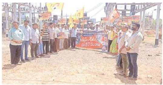
నిడమూరు విద్యుత్ సబ్ స్టేషన్ వద్ద