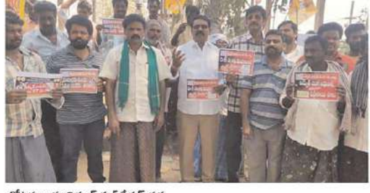
కోట్లవల్లూరు విద్యుత్ సబ్ స్టేషన్ వద్ద