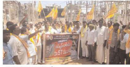
ఎమ్మిగూరు నియోజకవర్గం లో