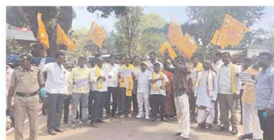
అల్లూరి సీతారామరాజు జిల్లా ఆనంతగిరి మండల కేంద్రంలో