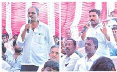
పెట్టించారని ఆరోపించారు. రాష్ట్ర వ్యాప్తంగా 26 వేల మంది జీసీలపై కేసులు పెట్టారన్నారు. అందుకే జీసీ రక్షణ పట్టం తీసుకోవాలి. న్యాయ సహాయానికి అయ్యే ఖర్చు కూడా ప్రభుత్వమే భరిస్తుందని హామీ ఇచ్చారు.