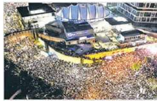
అంతర్జుట్లోకి వెళ్లి సైన్యాన్ని కూడా ధిక్కరించేందుకు మైనారిటీ ఉగ్రవాదులు చేస్తున్న ప్రయత్నాలు ఘోరమైన నేరమని ఆయన వ్యాఖ్యానించారు.

జెరుసలేం - వివాదాస్పద న్యాయ పునర్నిర్ణయ ప్రణాళికలను తాత్కాలికంగా ప్రంభంపజేస్తానని ఇజ్రాయేల్ ప్రధాని బెంజమిన్ నెతన్యాయు సోమవారం ప్రకటించారు. దేశవ్యాప్తంగా బందలు, ప్రదర్శనలు, సమ్మెలు ప్రజ్వలించుకున్న నేపథ్యంలో ఆయన రాజీనామాపై కనిపించారు. అరబులకు లేని చర్యలకు అవకాశం కల్పిస్తూ పార్లమెంట్ (కెనెట్) విరామ సమయం వరకు వివాదాస్పద చట్టాన్ని నిలిపివేస్తున్నామని ఆయన తెలిపారు. దేశాన్ని ముక్కలు చేసేందుకు మైనారిటీ తీవ్రవారులు ప్రయత్నిస్తున్నారని, అందుకే తాను సుతరాము అంగీకరించనని ఆయన స్పష్టంచేశారు. దేశాన్ని