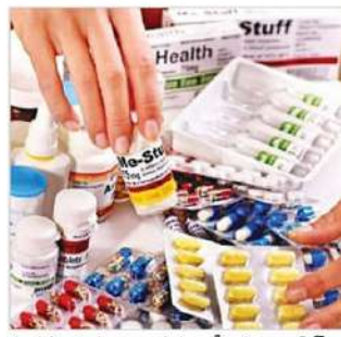
సంరక్షణ సాకర్యాలు దిగుమతి చేసుకున్న వ్యాక్సిన్లు, క్యాన్సర్ చికిత్సలు, సంతానోత్పత్తి మందులు, అనెస్థీషియా గ్యాసుల కొరతను ఎదుర్కొంటున్నాయి. సిరబిలు, మాత్రలు, ఇంజెక్షన్లు సహా చాలా మోఖక ఔషధాలు స్థానికంగా ఉత్పత్తి అవుతున్నప్పటికీ భారత్, చైనా, రష్యా ఐరోపా దేశాలతో పాటు యు.ఎస్, టర్కీ నుంచో వ్యాక్సిన్లు, క్యాన్సర్ నిరోధక మందులు, థెరపీల వంటి జీవనసంబంధ ఉత్పత్తుల్లో మెజారిటీని దిగుమతి చేసుకుంటుంది. పాకిస్థాన్ ప్రస్తుతం దాని క్షీణిస్తున్న సారెక్స్ నిలవలను పెంచుకోవడానికి ప్రయత్నిస్తోంది. గత వారం చైనా 500 మిలియన్ డాలర్లకు రిఫైనాన్స్ చేసిన తర్వాత 4.8 బిలియన్ డాలర్లూ అందనూ వేశారు.

కరాచీ - భారత్, చైనా, రష్యా యూరోపియన్ దేశాల నుంచి వ్యాక్సిన్లు, క్యాన్సర్ నిరోధక మందులు, చికిత్సల వంటి జీవనసంబంధ ఉత్పత్తులను ఎక్కువగా పాకిస్థాన్ దిగుమతి చేసుకుంటుంది. సవరించిన 2018 ధరల విధానానికి అనుగుణంగా కష్టతరమైన కేసులపై మూడేళ్ల పరిమితిని సమీక్షించాలని ద్రుగ్ దిగుమతిదారుల ప్రతినిధి సంఘం పాకిస్థాన్ కెమిస్ట్రీ అండ్ డ్రగ్స్ ట్రస్ట్ అసోసియేషన్ డిఆర్ఎస్పీ అధికారులను కోరింది. పాకిస్థాన్ బెషద్ నియంత్రణ అధికారీ వివాదాస్పద ధరల విధానం, క్షీణిస్తున్న స్థానిక కరిగ్నీ కారణంగా అప్పుల ఊజిలో కూరుకుపోయిన దేశంలో దిగుమతి చేసుకున్న ప్రాణాలను రక్షించే మందులకు తీవ్ర కొరత ఏర్పడిందని మీడియా నివేదికలు సోమవారం తెలిపాయి. ప్రస్తుతం తీవ్ర ఆర్థిక సంక్షోభంలో ఉన్న పాకిస్థాన్, అధిక బాంబు రుణాలతో సతమతమవుతోంది. ఏదేనీ మార్కెట్ నియంత్రణ క్షీణిస్తున్నాయి. గతేడాది జూన్ లో సంభవించిన విపత్తు వరదలు దేశంలోని మూడో వంతు ప్రజలను ముంచెత్తాయి. 33 మిలియన్లకు పైగా నిరాశ్రయితులయ్యారు. పాకిస్థాన్ ఆర్థిక వ్యవస్థకు 12.5 బిలియన్ల డాలర్ల ఆర్థిక సహకారం కలిగింది. మీడియా నివేదిక ప్రకారం, డాలర్-రూపాయి వ్యత్యాసం కారణంగా విదేశీయుల తమ సరఫరాలు నిలిపివేసిన తరువాత ప్రభుత్వ ప్రైవేట్ ఆరోగ్య