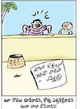
ఇలా గోడలు దూరమైతే, కోర్టు ఎత్తకెళ్లేవాడిని ఇంకా చాలా చేసినాడీ!

వర్తమాన రాజకీయాలలో ప్రజాప్రతినిధి అన్న పదానికి అర్థాలు మాలిపోయాయి. యువత సైతం రాజకీయాలు తమ కెరీర్ గా ఎంచుకునేందుకు రటపరాయిస్తున్న పరిస్థితి. ఈ పరిస్థితుల్లో రాజకీయాలకు ఒక హుందాతనాన్ని, ఒక క్రేజ్ ను కల్పించి, యువత సైతం ఆకర్షితులు అయ్యేలా చేయటం అంటే అంత అపహాసీ కాదు.