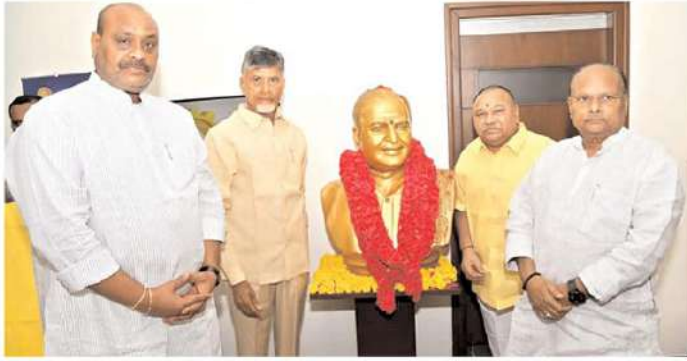
(15వ వేజ్ తరువాత)

జగన్ ఢిల్లీ వెళ్ళాడు అని చెబుతున్నాడు.. దానిపై ఆయనే సమాధానం చెప్పింది. ఎప్పుడు ఢిల్లీ వెళ్ళినా నోరెత్తకుండా వెనుబిరిగి వచ్చేస్తున్నాడు. మేం అధికారంలో ఉన్నప్పుడు హోదా సాధించడానికి గట్టిగానే ప్రయత్నించాం. దానికోసమే అప్పుడు కేంద్రంతో తెగదెంపులు చేసుకున్నాం."