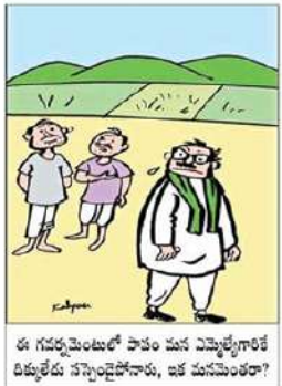
ఈ గవర్నమెంట్ లో పాపం చూడ ఎమ్మెల్యేగారికి దిక్కులేదు నన్నెంజెకోవారు, ఇక చంద్రబాబు?