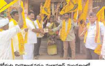
కోడుట్ల నియోజకవర్గం మల్లాపూర్ మండలంలో