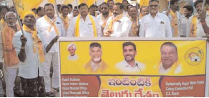
ఉప్పల్ నియోజకవర్గం రామంతపూర్ డివిజన్లో