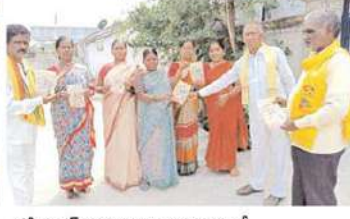
కరీంనగర్ అసెంబ్లీ నియోజకవర్గంలో