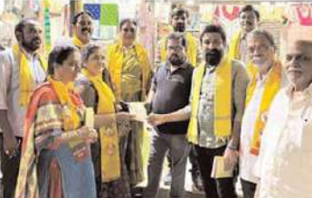
కూకట్ పల్లి నియోజకవర్గం కెపిహెచ్ టి డివిజన్లో