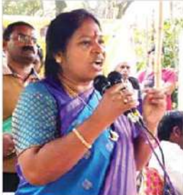
తెలివే అవకాశం ఉంటుందని స్పీకర్ వద్ద అధికార పార్టీ ఎమ్మెల్యేలకు వసేంటని ఆమె ప్రశ్నించారు. ఆంధ్రప్రదేశ్ దళిత్రలోనే ఇటువంటి పరిస్థితులు తాను ఎప్పుడూ చూడలేదని అన్నారు. సాధారణంగా ప్రతిపక్ష పార్టీ సభ్యులు స్పీకర్ వద్ద నిరసన తెలుపుతారని కానీ అధికార పక్షానికి స్పీకర్ పోడియం వద్దకు వచ్చి టి.డి.పి నేతలపై

బ్రిటిష్ కాలం వాటి జేబో నెంబర్ 1ను రద్దు చేయాలని కోలతే దానిపై చర్యకు అనుమతించని స్పీకర్ వద్ద తెలుగుదేశం పార్టీ శాసన సభ్యులు నిరసన తెలిపితే దాడులు చేయడం సలకారని మాజీ శాసనసభ్యులు గిడ్డి ఈశ్వరి అన్నారు. ఆంధ్రప్రదేశ్ అసెంబ్లీలో సోమవారం తెలుగుదేశం శాసనసభ్యులు దళిత శాసన సభ్యులపై వైఎస్ఆర్ కాంగ్రెస్ పార్టీ ఎమ్మెల్యేలు చేసిన దాడులను ఆమె ఖండించారు. వైయస్ జగన్మోహన్ రెడ్డి ఉద్దేశపూర్వకంగానే ప్రతిపక్షాల గొంతు నొక్కాలని జేబో నెంబర్ 1 తీసుకొచ్చారని దానిపై దర్శించాలని తెలుగుదేశం నేతలు పట్టుబట్టడం. దానికి స్పీకర్ అంగీకారం తెలపకపోవడంతో నిరసన తెలపడం సరైన పద్ధతేనని అన్నారు. నిరసన తెలిపే హక్కు ప్రతిపక్షాలకు ఉందని ఆమె పేర్కొన్నారు. అసెంబ్లీలో స్పీకర్ వద్ద ప్రతిపక్షాలు నిరసన