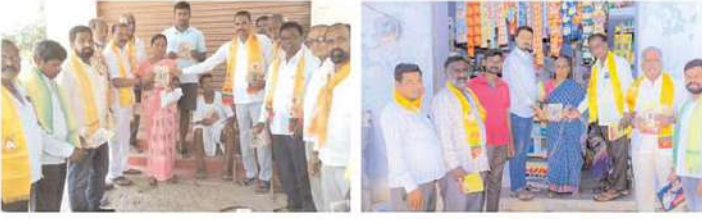
దుబ్బాక నియోజకవర్గం మిరియోడ్డి మండలంలో అమనగల్ మునిసిపాలిటీలో