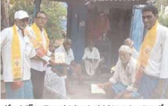
కరీంనగర్ నియోజకవర్గం శంకరపట్నం మండలంలో