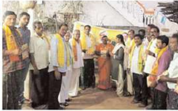
మధిర నియోజకవర్గం చింతకాని నియోజకవర్గం పాతర్లపాడు గ్రామంలో..