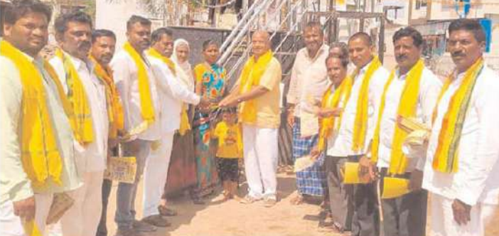
జగిత్యాల అసెంబ్లీ నియోజకవర్గంలో