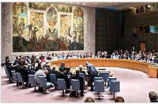
నివేదికల సారాంశమే సంధానీ నివేదిక. నివేదికను విడుదల చేస్తూ, ప్రపంచంలోని ప్రముఖ వాతావరణ శాస్త్రవేత్తలు, పాలిట్రామిక్ ఫ్యూర్య స్థాయి కంటే 1.5 డిగ్రీల సెల్సియస్ కు వేడెక్కడం అన్ని రంగాలలో లోతైన, వేగవంతమైన, స్థిరమైన గ్రీన్ హౌస్ వాయు ఉద్ధారణలను తగ్గించాల్సిన అవసరం ఉందని పేర్కొంది.

వాషింగ్టన్ - ప్రపంచ ఉష్ణోగ్రత పెరుగుదలను పాలిట్రామిక్ ఫ్యూర్య స్థాయిల కంటే 1.5 డిగ్రీల సెల్సియస్ కు పరిమితం చేసే అతి ముఖ్యమైన వాతావరణ లక్ష్యాన్ని ప్రపంచం కోల్పోయే అవకాశం ఉంది. అయితే ఈ దశాబ్దంలో కఠినమైన, అత్యవసర చర్యలు దీనిని నిరోధించగలవని వాతావరణ మార్పులపై ఇక్కరాజ్యసమితి ప్యానెల్ తెలిపింది. సోమవారం ఈ నివేదిక విడుదల చేసింది. వాతావరణ మార్పుల సంక్షోభం నివేదికపై ఇంటర్ గవర్నమెంటల్ ప్యానెల్ ను భారతదేశం న్యాయించింది. అది ఈ క్షేత్రంలో, వాతావరణ వ్యాధుల కోసం దేశం బిలుపును ఆమోదిస్తుందని పేర్కొంది. మానవజన్య ఉద్ధారణ కారణంగా ప్రపంచ ఉష్ణోగ్రత పెరుగుదలకు గల కారణాలు, పర్యవసానాలపై ఐటీసీఐ 2015 నుంచి రూపొందించిన అన్ని