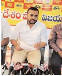
ఎస్పి, ఎస్సీ పబ్ వాన్ నిధులలో కొత్త విధించడం దళిత వర్గాలకు తీవ్ర

కేటాయించకపోవడం బాధాకరం అన్నారు. రాష్ట్రంలో వ్యవసాయ, పశు సంపర్క శాఖలను నిర్లక్ష్యం చేశారని అన్నారు. రైతులకు వ్యవసాయ పెట్టుబడి ఖర్చులు 26 శాతం తగ్గించామనడం అంకా బోగోని అని, పెట్టుబడి ధరలు పెరగడం, పండించిన వంటకు గిట్టుబాటు ధరలు లేకపోవడం రైతులు తీవ్ర ఆర్థిక ఇబ్బందులతో కొట్టుమిట్టాడు తున్నారని ఆరోపించారు. యువతకు వైపుడ్వీ కేరణ తరగతులకు నిధులు కేటాయించకపోవడం అన్యాయం అన్నారు.