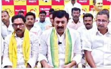
డిమాండ్ చేశారు. ఈ సందర్భంలో మంత్రి ఉషశ్రీ చరణ్ మీడియాతో మాట్లాడుతూ బీబుర్ వాడే ఛాంబర్ నాడే కానీ మాటలు మాత్రం కాదని మాట్లాడడం వైసిపి మంత్రులకే