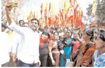
అధికారంలోకి వచ్చి నాలుగేళ్లు అయినా కూర్చునేతలు మినహా, ఏ విధమైన అభివృద్ధి కార్యక్రమాలు చేపట్టలేదని చెప్పారు. మునిసిపాలిటీ లు, స్థానిక సంస్థలను పూర్తిగా దివాలా తీయించి నిర్లక్ష్యం చేశారని తెలిపారు.

మదనపల్లిలో టోమాటో రైతుల కష్టాలు తీర్చే విషయంలో టీడీపీకి స్పష్టమైన ప్రణాళిక వున్నదని తెలుగుదేశం పార్టీ జాతీయ ప్రధాన కార్యదర్శి నారా లోకేష్ వెల్లడించారు. మదనపల్లి లో టోమాటో ప్రాసెసింగ్ యూనిట్ ఏర్పాటు తో పాటు కోల్డ్ స్టోరేజీ నిర్మాణానికి చర్యలు చేపడతామన్నాడు. యువగళం పాదయాత్రలో భాగంగా శుక్రవారం పలువురు ప్రముఖులు లోకేష్ కో సమావేశం అయ్యారు. ఈ సందర్భంగా పట్టణంలో, ముఖ్యంగా టోమాటో రైతులు ఎదుర్కొంటున్న సమస్యలు ను లోకేష్ దృష్టికి తీసుకు వచ్చారు. చాటిపై లోకేష్ సానుకూలంగా స్పందిస్తూ మదనపల్లి పట్టణంలో సమస్యల పరిష్కారానికి ప్రతాపికాలర్గంగా కృషి చేయగలమన్నాడు. జగన్