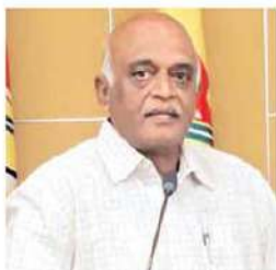
డాక్టర్ ఎన్ బి సుధాకర్ రెడ్డి, రాష్ట్ర అధికార ప్రతినిధి

నేతలు అడ్డదారులు కొక్కే ఓటమి నుంచి బయట పడాలని చూస్తున్నారు. ఇప్పటికే ఉపాధ్యాయులకు ఓటుకు ఐదు వేలు పంపిణీ చేశారని తెలిసింది. డబ్బు తీసుకుని ఓటు వేయడం హీనమైన చర్య అని తెలిసినప్పటికీ వేధింపులకు పాల్ పడి డబ్బు తీసుకుంటున్నారని కొందరు మిత్రులు చెప్పారు. అయితే ఓటు మాత్రం వైకాపా అభ్యర్థులకు వ్యతిరేకంగా వేస్తామని వారు చెప్పారు. కాగా శుక్రవారం నుంచి పట్టణం స్థానాలకు కూడా ఓటుకు రెండు 23 శాతానికి కుదిపించడం పంపిణీ చేయడానికి వైకాపా నేతలు సిద్ధమవుతున్నారు. వైకాపా బలపడుతున్న ఉపాధ్యాయుల అభ్యర్థులు 10 కోట్లు, పట్టణంపై అభ్యర్థులు 100 కోట్లు, అససరమైతే మరలంకా పార్టీ పెట్టడానికి సిద్ధమవుతున్నారని తెలిసింది. ఇప్పటికే వైకాపా వారు వేలాది బోగ్స్ ఓట్లను చేర్చింది ఉన్నారు. అయితే టిడిపి నాయకులు, కార్యకర్తలు అడుగుడుగునా బోగ్స్ ఓట్ల ఇతర అడ్డుకోలు వ్యవహారాలను అడ్డుకుంటున్నారు. ప్రతి టిడిపి కార్యకర్త వైకాపా అధికారంపై ఎదుర్కోవడం పోరాడడానికి సిద్ధంగా ఉన్నారు. ఈ నేపథ్యంలో వైకాపా ఎన్ని కుట్టులు, కుయుక్తులు పన్నినా మూడు పట్టణం స్థానాలలో టిడిపి అభ్యర్థులు విజయం ఖాయం . ఉపాధ్యాయ స్థానాలలో కూడా వైకాపా ఓటమి తథ్యం.