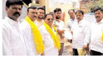
వజ్రకరూరు మండల కేంద్రంలోని మసీద్ స్ట్రీట్, బ్రాహ్మణ వీధి, వడ్డే వీధి, ఎస్సీ కాలనీ, మాల వీధి, దిన్న బావి వీధి, చెన్న వీధి, గడన గడ్డ వీధి, బస్టాండ్