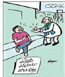
ఈ విధివల్లనే మనకాద మనం నా దగ్గర వదిలి పోక ఉన్నాము, పనికిరాని వాళ్ళు

శాసనమండలి పట్టిభద్రుల నియోజకవర్గాలకు ఈనెల 13 వ తేదీన జరుగనున్న ఎన్నికలలో ద్వితీయ ప్రాధాన్యత (2) ఓటు పై తెలుగుదేశం పార్టీ స్పష్టత నిచ్చింది. పట్టిభద్రుల నియోజకవర్గాలలో పిడిఎఫ్ అభ్యర్థులకు ద్వితీయ (2) ప్రాధాన్యత ఓటు వేయాలని టిడిపి నిర్ణయించింది. ఈ మేరకు పార్టీ ఆమోదించిన రాజకీయ తీర్మానాన్ని టిడిపి రాష్ట్ర అధ్యక్షుడు కింజరాపు అప్పెన్నాయుడు గురువారం పత్రికలకు విడుదల చేశారు. టిడిపి అభ్యర్థులకు మొదటి (1) ప్రాధాన్యత ఓటు వేయాలని కోరారు. మిగిలిన ప్రాధాన్యత విషయంలో ఓటర్లు అవగాహన మేరకు వేయాలని కోరారు. వైసీపీ అభ్యర్థులకు ఏ విధమైన ప్రాధాన్యత ఓటు వేయకూడదని విజ్ఞప్తి చేస్తూ తీర్మానించారు. వైసీపీ అరాచకాలు, దౌర్జన్యాలు, అనినీతికి ఆధ్వర్యం వేసి అవకాశం ఈ ఎమ్మెల్యే ఎన్నికల ద్వారా లభించిందని టిడిపి అభిప్రాయపడింది. ఈ ఎన్నికలలో వైసీపీని ఓడించటమే ఏకైక లక్ష్యంగా ఆందోళన చేయాలని టిడిపి విజ్ఞప్తి చేసింది. టిడిపి తో కలసి వచ్చే వామపక్షాలకు సహకరించాలని నిర్ణయించారు. ప్రజాసంఘాలు కు స్వచ్ఛ లేకుండా చేసి ప్రజాస్వామ్యాన్ని జగన్ అవహేళన చేస్తున్నారని టిడిపి పేర్కొంది. కత్తి మర్దం, ఇతర దౌర్జన్యాలకు పొచ్చిడి ముద్దాయిగా ఉన్న వ్యక్తిని కూర్చు రాయలసీమ గ్రాడ్యుయేట్ ఎన్నికలలో వైసీపీ అభ్యర్థిగా నిలబెట్టారని టిడిపి పేర్కొంది. ఇలాంటి అరాచక శక్తులకు బుద్ధి చెప్పి ప్రజాస్వామ్యాన్ని కాపాడుకుందాం అని టిడిపి పిలుపు నిచ్చింది.