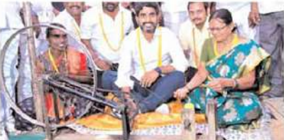
చేనేత బాధ్యత నాది” అని తెలుగుదేశం పార్టీ జాతీయ ప్రధాన కార్యదర్శి నారా లోకేష్ హామీ

“మంగళగిరి లో నేను వెళ్లి చేస్తున్నాను. చేనేత సామాజిక వర్గం నన్ను దత్తత తీసుకోవాలని కోరుతున్నాను. మీ సమస్యలపై నేను పోరాడుతాను. టిడిపి గెలిచిన తరువాత సమస్యలు పరిష్కారం