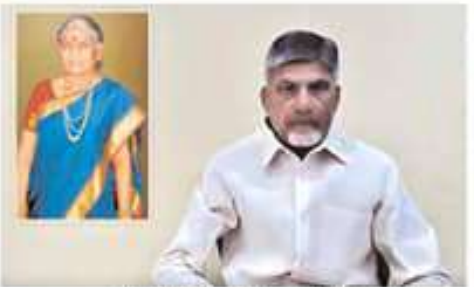
స్వీయ అనుభవం, కల్పనా దూరం ప్రజా కష్టాలలోనుంచి ఉద్ధరించడం. చంద్రబాబు అందరినీ ఉత్తరంపుడు ఉపదేశాని.

మా అమ్మ కష్టం సురేపతికి రాకూడదు. అందుకే దీపం పధకం తెచ్చి నా భార్య నాకు పెద్ద బహుమానం, అమెను నేనేమి బహుమానం చెప్పగలను? మహిళా సాంకేతికతను సాకారం చేసి చూపించి దీదీపియే చట్టసభల్లో రిజర్వేషన్లు కోసం పోరాటం కొనసాగుతుంది. మహిళా విశోత్సవ సందర్భంగా వంద ప్రాంతాల్లో మహిళలతో చంద్రబాబు పర్యవేళి సంభాషణ