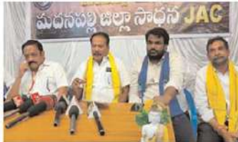
మదనపల్లి జేపీసీ ఆధ్వర్యంలో కృతజ్ఞత సభ నిర్వహించారు. జేపీసీ సభ్యులు నారా లోకేష్ కి