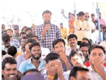
సునీల్: మీరు రూలింగ్ లోకి వచ్చాక ఏపీకి పెట్టుబడులు, ఉద్యోగాలు ఎలా కల్పిస్తారు? గంజాయి కట్టడికి ఏం చర్యలు

సునీల్: పెట్టుబడులు, ఉద్యోగాలు పన్నాయి అని జగన్ రెడ్డి చెబుతున్నాడు. మాకు ఉద్యోగాలు రావడం లేదు. భవిష్యత్తులో అయినా మాకు ఉద్యోగాలు వస్తాయా? లోకేష్: ఏపీలోని అన్ని ప్రాంతాలను అభివృద్ధి చేసింది టిడిపి. టిడిపి పాలనలో 40వేల పరిశ్రమలతో లక్షల ఉద్యోగాలు తెచ్చామని వైసీపీ ప్రభుత్వమే ఒప్పుకుంది. మనం అధికారంలోకి వచ్చాక పెట్టుబడులు పరిగెత్తుకుంటా వస్తాయి. నేను మాట ఇస్తున్నా. ఇతర రాష్ట్రాల్లోని ప్రముఖ కంపెనీల్లో ఉన్నత స్థానాల్లో మన రాష్ట్రం వాళ్లే అధికారంగా ఉన్నారు. అది చంద్రబాబు ఘనత. జగన్ రెడ్డి అధికారంలోకి వచ్చాక యువత పక్క రాష్ట్రాలకు వలస వెళ్లిపోతున్నాడు. టిడిపి పాలనలో మనం చేసుకున్న ఒప్పందాల కర్పణకే 2019లో మనం అధికారంలోకి వస్తే ఇప్పటికే 50లక్షల ఉద్యోగాలు పచ్చేవి. మనం అధికారంలోకి వచ్చిన 100రోజుల్లో పరిశ్రమలు, ఉద్యోగాలు తెచ్చే బాధ్యతను మేం తీసుకుంటాం.