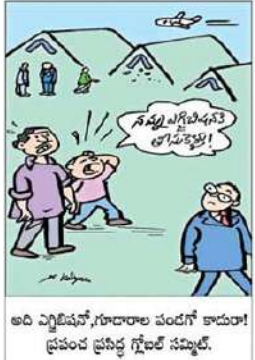
అది ఎన్నికలసభ, గూడారాల వండగో కాదు! ప్రపంచ ప్రసిద్ధ గ్లోబల్ సమ్మిట్.

ఆలోచించాలని కోరారు. కుప్పం, పలమనేరు లకు పరిశ్రమలు వచ్చినా, పుంగనూరుకు ఎందుకు రాలేదని ప్రశ్నించారు. దీన్నిబట్టి ఇక్కడి ఎంపిలవకు ప్రజలపట్ల ఎంత బిన్న చూపు వున్నదో అర్థమవుతుందని చెప్పారు. అక్రమకేసులకు ఎవరూ భయపడవద్దని, టిడిపి అధికారంలోకి రాగానే వాటన్నింటినీ రద్దుచేసి, హోదానీ యువతకు పెద్దపీట వేస్తామని వెల్లడించారు. రాష్ట్రంలో జగన్ మూడుముక్కలాట అడుగున్నాడని చెప్పారు. ఏ సంస్థకూ రాష్ట్రంపై నమ్మకం కుదరదంటుంటే రద్దుచేస్తాం. ఇదే పరిస్థితి కొనసాగితే ఎవీ యువత దిరునామా తెలంగాణ, కర్ణాటక, తమిళనాడు లేదా ఉత్తరప్రదేశ్ అయ్యే ప్రమాదమున్నదని ఆందోళన వ్యక్తం చేశారు. యువత కోసమే తాను 34 రోజులుగా పాదయాత్ర చేస్తున్నట్లు చెప్పారు. జగన్ సిఎం అయినప్పటినుంచి పరిశ్రమలను రాష్ట్రం నుంచి తరిమేస్తున్నదని విమర్శించారు. యువతకు ఉపాధి లేక ఇబ్బందలు పడుతున్నారన్నారు. ఫాక్స్ కాన్ కంపెనీపిటి నుంచి