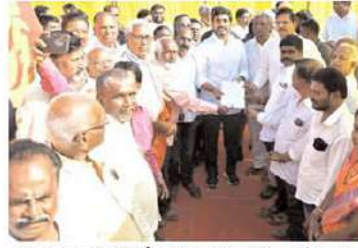
బిత్రికలెస్తూ తప్పుడు కేసులు బనాయిందడం జగన్ రెడ్డి నీచత్వానికి నిదర్శనం అని విమర్శించారు. చరిత్రలో మద్దం పాపుల వద్ద టీచర్లను కాపలా పెట్టిన పనికీమాలిన ప్రభుత్వాన్ని గళం లో ఎప్పుడూ చూడలేదన్నారు. న్యాయమైన హక్కుల కోసం ఉపాధ్యక్షులు చేసే పోరాటానికి తెలుగుదేశం పార్టీ అండగా వుంటుందని హామీ ఇచ్చారు.

హయాంలో తాము పదిని ఇబ్బందుల గురించి వారు లోకేశ్ కు వివరించారు. వారి సమస్యలపై లోకేశ్ సానుకూలంగా స్పందించారు. జగన్ నేతృత్వంలో సైకో ప్రభుత్వం ఉపాధ్యక్షులను వేధించడమే పనిగా పెట్టుకుందని విమర్శించారు. డిమాండ్ సాధన కోసం పోరాడిన ఉపాధ్యక్షులు, ఉద్యోగులపై కేసులు బనాయిందడం నియంతృత్వ పోకడలకు బిందర్లనుమన్నారు. ప్రభుత్వానికి వ్యతిరేకంగా గొంతెత్తి నిలబడిన వారిని రకరకంగా వేధించటం జగన్ రెడ్డికి అలవాటుగా మారందని ఆరోపించారు. భావిభారత పౌరులను కయారు చేసే గురువులను డొంగలుగా