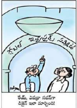
కే.వి. ఎవడూ నడవినా దీక్షలే ఇలా మార్చింది!

గన్నవరం టిడిపి కార్యాలయానికి అర్జునుడు భౌతిక కాయం... చంద్రబాబు నివాళి