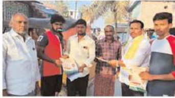
వాపాడు మండలంలోని మదూరు గ్రామ