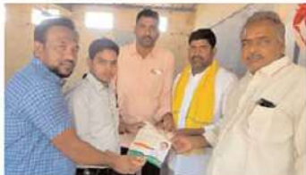
పెద్దపప్పురు మండల కేంద్రం లో పశ్చిమ రాయలసీమ పట్టభద్రుల ఎన్నికల ప్రచారం లో భాగంగా పెద్ద