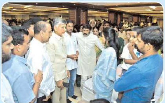
నందమూరి తారకరత్న దశదిన కర్త నందర్లంగా నివాళి అర్పించి, కుటుంబ సభ్యులను పరామర్శించిన దిడిపి అధినేత చంద్రబాబు నాయుడు, నందమూరి బాలకృష్ణ తదితరులు