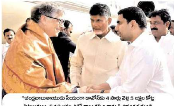
"చంద్రబాబునాయుడు సీయంగా దాహోన్ముకు 4 సార్లు వెళ్లి 5 లక్షల కోట్ల పెట్టుబడులు, 5.13 లక్షల ఉద్యోగాలు కల్పించారు." దివంగత కుంతి మేకపాటి గౌతంరెడ్డి శాసనమండలిలో చివరికప్పుర్యక ప్రకటన

రాష్ట్రప్రభుత్వం అనుసరిస్తున్న విధానాలు, పీవీఎల్ సై అనుసరించిన వైఖరిని తప్పుబట్టారు. దిన్నిబట్టి పారిశ్రామికవేత్తల దృష్టిలో రాష్ట్రం పట్ల అభిప్రాయం ఏవిధంగా వున్నదో అవగతం అవుతున్నది. మరోవైపు రాజకీయ కక్షలు, అంతులేని అవినీతి దాహానికి ఎంతోమంది పారిశ్రామిక వేత్తలు