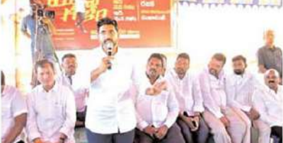
భాగంగా చంద్రగిరి నియోజకవర్గం మామండూరు విడిది కేంద్రంవద్ద మంగళవారం రజకసామాజిక

టిడిపి అధికారంలోకి రానే జరివద్దాల రక్షణకోసం ప్రత్యేక చట్టం తీసుకు వస్తామని తెలుగుదేశం పార్టీ జాతీయ ప్రధాన కార్యదర్శి నారా లోకేష్ వెల్లడించారు. తిరుమలతో సహా రాష్ట్ర వ్యాప్తంగా వున్న దేవాలయాలు అన్నింటిలో బిట్లలు ఉడికే రజకులకు కాంట్రాక్టులు ఇస్తామని చెప్పారు. యువగళం పాదయాత్రలో