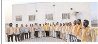
తెలుగుదేశం పార్టీ చేపట్టి ఇంటింటికి తెలుగుదేశం కార్యక్రమం అదేవిధంగా మహిళల ప్రతి ఇంటికి వెళ్లి బొట్టు పెట్టి కార్యక్రమము, సభ్యత్వ సమోదయ కార్యక్రమము గతంలో తెలుగుదేశం చేపట్టిన అభివృద్ధి కార్యక్రమాలు ప్రతి గడపగడపకు వెళ్లి వివరించుకుంటూ వారికి కరపత్రాలు ఇవ్వడం జరుపుటకు ఉన్నట్ అసెంబ్లీ నియోజకవర్గంలోని పది డివిజన్ల ముఖ్య నాయకులు, డివిజన్ అధ్యక్ష కార్యదర్శులతో సన్మాహక సమావేశం.

చూపిన వారిపై దాడులు చేయడం, తిరిగి బాధితులపై తప్పుడు కేసులు పెట్టి వేధింపడం జగన్ పాలనలో నిత్యకృత్యమైపోయింది. సమస్యలను పరిష్కరించాల్సింది పోయి... ఏదో ఒక పాకు చూపి దాడి చేయడం, తిరిగి కేసులు పెట్టడం జగన్ రెడ్డి ఆరాచక పాలనకు అద్దం పడుతోంది. ప్రజలు ఎదుర్కొంటున్న సమస్యల గురించి మాట్లాడితే అంతలా వేధించే జగన్ రెడ్డిని పైకో కాక ఇంటిమనారా? నేటి ఘటనకు ప్రతీకారం తీర్చుకునేందుకు ప్రజ జీసీ సోదరుడు ఏకమై నిన్ను నీ పార్టీని బంగాళాఖాతంలో పడేయడం తధ్యమని గుర్తుంచుకో. నీ పిచ్చి పాలనకు, కక్ష సాధింపు పర్యలకు వచ్చే ఎన్నికల్లో సమాధి కడతాం.