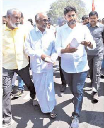
గ్రామస్థులు యువనేతకు గణపూలతో స్వాగతం పలికారు. కాశిపెంట్ల గ్రామంలోని హెలికాప్టర్ కంపెనీ ఉద్యోగులు యువనేతకు పుష్పగుచ్ఛాలతో స్వాగతం పలికారు. సిబ్బందిని యువనేత ఆవ్యాయంగా పలకరించారు.

రాష్ట్రంలో జగన్మోహన్ రెడ్డి అరాచకపాలనపై గణపెత్తుకూ బిడిపి యువనేత నారా లోకేష్ చేపట్టిన యువగళం పాదయాత్ర మంగళవారంతో నెలరోజులు పూర్తిచేసుకుంది. 30వరోజు పాదయాత్ర పూర్తయ్యే సమయానికి 397.3 కిలోమీటర్లకు చేరుకుంది. బుధవారం ఉదయం యువగళం పాదయాత్ర 400 కిలోమీటర్లు పూర్తిచేసుకుంది. ముందుగా నిర్ణయించిన ప్రకారం రోజుకు సగటున 10కిలోమీటర్లు పాదయాత్ర