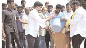
రోజురోజుకు పోలీసుల వింతప్రవర్తన పోలీసుల ప్రవర్తన రోజురోజుకూ వింతగా మారుతోంది. నేను ప్రజల్ని చూడటానికి స్కూలు ఎక్కడో దాన్ని కూడా

సదాశివపురంలో స్థానికులతో లోకేశ్ ముఖముఖ సమావేశమయ్యాడు. ఈ సందర్భంగా యువనేత మూక్కూడుతూ... నీవం జగన్ వికృత చిహ్నాలకు భయపడను. నేను మాట్లాడకుండా పోలీసులు అడ్డుకుంటున్నారు. అత్యాచారాలు, హత్యలు చేసేవారైతే అడ్డుకోకుండా... పోలీసులు నన్ను అడ్డుకోవడమేమిటని ప్రశ్నించారు. జగన్ ఆగడాలు శ్మశిమిందాయి... తాను శాంతియుతంగా గాంధీయూమ్మార్గంలో పాదయాత్ర చేస్తుంటే జగన్ అడ్డుకుంటున్నాడని దుయ్యబట్టారు. రాష్ట్రంలో అన్ని నిత్యవసర వస్తువుల ధరలు పెరిగిపోయాయి. ప్రజల తరఫున పోరాడుతుంటే జగన్ మా గొంతు నొక్కుతున్నాడని అన్నారు. బాబు రావాలి.. బాధలు పోవాలి. చంద్రబాబు అధికారంలో ఉంటే సమస్యలే ఉండవు. చంద్రబాబును మాస్ట్రీ కంపెనీలు గుర్తొస్తాయి, జగన్ ను మాస్ట్రీ జైలు గుర్తొస్తుందని చెప్పారు.