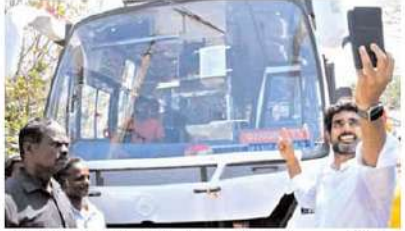
యువగళం పాదయాత్ర సందర్భంగా సత్యవేడు

డిక్టన్ కంపెనీ వాహనం చూసి ఆనందభాష్యాలు అక్కచెల్లెమ్మలు ఉద్యోగానికి వెళ్ళటం గర్వంగా వుంది ఇలాంటి ఒక్క కంపెనీ అయినా తెచ్చావా జగన్ లంటూ ప్రశ్న "బలకను పెంచాను ఎగిరిపోయింది. ఉరుతును పెంచాను పారిపోయింది. మొక్కను పెంచాను. ప్రస్తుతం రెండూ వచ్చి చేరాయి." అని మిస్సెల్ మ్యాన్ మాజీ రాష్ట్రపతి అబ్దుల్ కలాం చెప్పిన నిత్యసత్యం. నేను నమ్మే సిద్ధాంతం అని తెలుగుదేశం పార్టీ జాతీయ ప్రధాన కార్యదర్శి నారా లోకేష్ వెల్లడించారు.