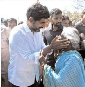
రైతు సంక్షేమానికి సంబంధించి వివిధవిధానాలను త్వరలోనే మేనిఫెస్టో రూపంలో వెల్లడించనున్నట్లు తెలుగుదేశం పార్టీ జాతీయ ప్రధాన కార్యదర్శి నారా

రుణాలను దశలవారీగా రద్దుచేశారని వివరించారు. దీనివల్ల రాష్ట్రంలో 80 శాతం మంది రైతులు లబ్ధిపొందారని చెప్పారు. అన్నదాత సుఖభవ కార్యక్రమం ద్వారా రైతులకు నేరుగా అరి ఖాతాల్లోకి డబ్బులు వేసింది చంద్రబాబే అని తెలిపారు. చంద్రబాబు హయాంలో పొడిపరిశ్రమకు పలు ప్రోత్సాహకాలిచ్చి అభివృద్ధి చేసి, నేడు జగన్ దానిని మూలనపడేశాడని చెప్పారు. మామిడి రైతులకు గిట్టుబాటు ధరపై రెండురూపాయలు అదనంగా ఇప్పించటంతో పాటు, ఆకాశ రైతులకు విద్యుత్ బిల్లులు తగ్గించి చంద్రబాబు ఆడుకునందన్నారు. దేశంలో ఎక్కడా లేనివిధంగా చంద్రబాబు పాలనలో వ్యవసాయం, అనుబంధరంగాలు అభివృద్ధి చెందాయని వివరించారు. వేలకోట్లు వ్యయం చేసి నీటిపారుదల ప్రాజెక్టులను ముందుకు తీసుకెళ్లి, కృష్ణా నదీజలాలను రాయలసీమకు తెచ్చారని వివరించారు. రైతురాజ్యం తెస్తానని చెప్పిన జగన్, ప్రస్తుతం రైతులను రాజ్యాంగా చేశారని విమర్శించారు.