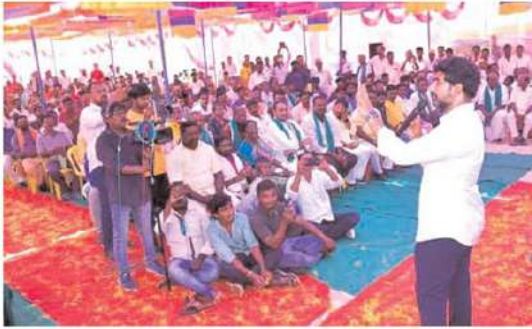
ప్రసంగించకుండా ప్రవార వాహనం, మైకు బలవరకు నిల్పునేందుకు స్థూలు కూడా లేకుండా పోలీసులు లాక్కెళ్లారన్నారు. తాడేపల్లి సైకో ఆడకాలతో పోలీసులు తనను ఇబ్బంది పెడుతున్నారని చెప్పారు. ఆడేశాలు ఇస్తున్న వారెవరూ భవిష్యత్ లో కాపాడలేరన్న విషయాన్ని పోలీసులు గమనించాలని కోరారు.

రాష్ట్రంలో నిరుద్యోగం, పేదరిక సమస్యలను నిర్మూలించే బళగా ప్రణాళికలు సిద్ధం అవుతున్నాయని తెలుగుదేశం పార్టీ జాతీయ ప్రధాన కార్యదర్శి నారా లోకేష్ వెల్లడించారు. రాష్ట్రంలో నిరుద్యోగ సమస్య తీవ్రరూపం రాబ్ది ఎంతోమంది ఆత్మహత్యలకు పాల్పడుతున్నారని ఆవేదన వ్యక్తం చేశారు. యువగళం పాదయాత్రలో భాగంగా గురువారం సత్యవేడు నియోజకవర్గం కె పి జి పురంలో ప్రజలనుద్దేశించి లోకేష్ మాట్లాడారు. లోకేష్ తన ప్రసంగాన్ని కొనసాగిస్తూ టిడిపి అధికారంలోకి రాగానే బంగాళు ఆంధ్రప్రదేశ్ కు నిర్మించుకోని, విద్యావంతులు అందరికీ స్థానికంగానే ఉద్యోగాలు కల్పించే బళగా ప్రయత్నాలు చేస్తామన్నారు. అడుగుడుగునా సమస్యలు ఎదుర్కొంటున్న ప్రజల తరపున తాను బోరాడుతున్నానని చెప్పారు. తాను