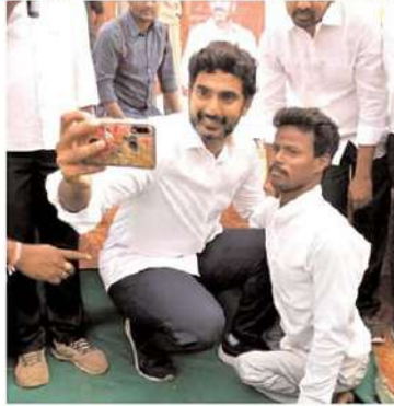
ఎదురుచూస్తున్న వ్యవసాయమంత్రి రైతులకోసం ఏం చేస్తాడని ప్రశ్నించారు. పోలీసులు ఎన్ని అంక్షలు విధించినా నేను వెనుకడుగు వేసే ప్రసక్తే లేదని స్పష్టం

రుణాలను దశలవారీగా రద్దుచేశారని వివరించారు. దీనివల్ల రాష్ట్రంలో 80 శాతం మంది రైతులు లబ్ధిపొందారని చెప్పారు. అన్నదాత సుఖభవ కార్యక్రమం ద్వారా రైతులకు నేరుగా అరి ఖాతాల్లోకి డబ్బులు వేసింది చంద్రబాబే అని తెలిపారు. చంద్రబాబు హయాంలో పొడిపరిశ్రమకు పలు ప్రోత్సాహకాలిచ్చి అభివృద్ధి చేసి, నేడు జగన్ దానిని మూలనపడేశాడని చెప్పారు. మామిడి రైతులకు గిట్టుబాటు ధరపై రెండురూపాయలు అదనంగా ఇప్పించటంతో పాటు, ఆకాశ రైతులకు విద్యుత్ బిల్లులు తగ్గించి చంద్రబాబు ఆడుకునందన్నారు. దేశంలో ఎక్కడా లేనివిధంగా చంద్రబాబు పాలనలో వ్యవసాయం, అనుబంధరంగాలు అభివృద్ధి చెందాయని వివరించారు. వేలకోట్లు వ్యయం చేసి నీటిపారుదల ప్రాజెక్టులను ముందుకు తీసుకెళ్లి, కృష్ణా నదీజలాలను రాయలసీమకు తెచ్చారని వివరించారు. రైతురాజ్యం తెస్తానని చెప్పిన జగన్, ప్రస్తుతం రైతులను రాజ్యాంగా చేశారని విమర్శించారు.