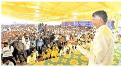
మరింత అనుసంధానం కోసం ఈ విభాగం పని చేస్తుంది. ఇప్పటికే పార్టీ స్ట్రక్చర్ లో ప్రతి 25 వేల ఓట్లకు ఒక క్వసర్ ఇన్ చార్జ్, 5 వైలకు ఓట్లకు ఒక యునిట్ ఇన్ చార్జ్, 1000 ఓట్లకు బూక్ ఇన్ చార్జ్ నియమించడం జరిగింది. ఇక నుంచి ప్రతి 30 కుటుంబాలకు ఒక కుటుంబ సాధికార సారధి ని టీడీపీ నియమిస్తుంది.

వ్యతిరేక విధానాలను పార్టీ దృష్టికి తీసుకు వెళ్లారు. క్షేత్ర స్థాయి ప్రజా సమస్యలు తెలుసు కోవడం ద్వారా సూక్ష్మ స్థాయి మ్యానిఫెస్టో రూపకల్పనకు ప్రణాళికలు రూపొందిస్తారు. పార్టీ అధికారంలోకి వచ్చిన తరువాత కుటుంబ సాధికార సారధి వారి పరిధిలోని కుటుంబాల ప్రగతికి అవసరమైన చర్యలు తీసుకునేలా పని చేస్తారు. బూక్ రిలీఫ్ లో ప్రతి ఇంటికి ఈ సారధులు వారధులుగా పని చేస్తారు. పార్టీలో ఉన్న సెక్షన్ ఇన్ చార్జీలు అందరినీ కుటుంబ సాధికార సారధులుగా బిలుస్తారు. అవసరమైన చోట్ల నియామకాలు చేపట్టి బాధ్యతలు ఆప్పగిస్తారు. ప్రతి నియోజకవర్గంలో కుటుంబ సాధికార సారధి విభాగం ఉంటుంది. పార్టీ కి ప్రజలకు మద్ద