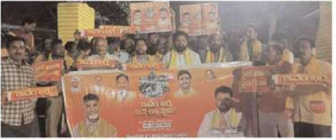
పాలకొండ నగర పంచాయతీ (ఇందిరా నగర్ కోలని,వడమ) 5,6,7,8 వార్డ్ లలో "ఇదేం కర్ష మన రాష్ట్రానికి" కార్యక్రమంలో పాలకొండ నియోజకవర్గం ఇండార్ శ్రీ నిమ్మక,జయశ్రీష్ట పాల్గొన్నారు.