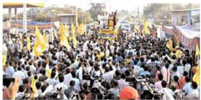
చంద్రబాబుపై పూలవర్షం కురిపించారు. పలు ప్రాంతాలలో మహిళలను ఉద్దేశించి చంద్రబాబు

ఇదేం ఖర్చు మన రాష్ట్రానికి కార్యక్రమంలో భాగంగా ఉమ్మడి తూర్పుగోదావరి జిల్లా పర్యటనకు వెళ్లిన తెలుగుదేశంపార్టీ అధినేత చంద్రబాబు నాయుడుకు రాజమండ్రి విమానాశ్రయం వద్ద బుధవారం ఘన స్వాగతం లభించింది. జిల్లాకు చెందిన నాయకులు, కార్యకర్తలు పెద్ద సంఖ్యలో చంద్రబాబును స్వాగతం పలికారు. మహిళలు మంగళవారంనాడు రాజమండ్రి విమానాశ్రయం నుంచి జగన్ పేట వరకు అడుగుడుగునా బ్రహ్మరథం వట్టారు. భారీ వాహన శ్రేణితో యువకులు చంద్రబాబును తోడొప్పించి వెళ్లారు. దారిపొడవునా ప్రతిచోటా