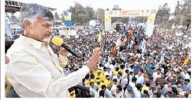
'చంద్రన్న'కు తూర్పున బ్రహ్మరథం

ఇచ్చారు. ఇటీవల వరదలకు ముంపు గ్రామాల్లో ప్రభుత్వం కనీసం బాధితులకు భోజనం కూడా పెట్టలేదని విమర్శించారు. పోలవరంలో దొంగ పట్టణం పెట్టి పరిహారం కోట్లనే ప్రయత్నం చేశారు. అధికారంలోకి వచ్చిన కరువాక అన్నిటిపై విచారణ జరుపుతామని చెబుతారు. గృహసారథులకు సహకారించవద్దు గృహ సారథులు పేరుతో వైసిపి వాళ్ళు ఇంటింటికి వస్తున్నారు. జగన్ కే ఓటు వేస్తామని ఒట్టు వెయ్యాలట. మళ్ళీ జగన్ కే ఓటని ఇంట్లో ఉన్న ఫ్యామిలీకు ఉరేసుకోవాలా? అని చంద్రబాబు విమర్శించారు. ఎవరైనా జగన్ స్టిక్కర్ లు ఇంటికి అంటిస్తే అంకితం చేయండి. గృహ సారథులు ఇంటికి వస్తే సహకారించకండి. మీకు ఏమీ కాదు. నేను అందంగా ఉంటా. అని భరోసా ఇచ్చారు. గోకవరంలో డిగ్రీ కాలేజీ కావాలి అన్నారు. ప్రభుత్వం వచ్చిన తరువాత కాలేజీ ఏర్పాటు చేస్తానని హామీ ఇచ్చారు. ప్రజలు గమనించాలి, మీకు ఇంట్లో 10, రూపాయలు, దోచేది రూ. 50 రూపాయలు. ప్రజలపై 48 రకాల పన్నులు వేసిన ఘనము ఈ ముఖ్యమంత్రి, అని చంద్రబాబు విమర్శించారు. జగన్ పని అయిపోయింది. ఓడిపోతున్నాడు. గాలికి వచ్చిన పార్టీ గాలికి పోతుంది అని చెబుతారు. జగన్ సిగ్గుచేటుండా కడపలో స్ట్రీట్ ప్రాంట్ కు రెండోసారి భూమిపూజ చేశాడన్నారు. ప్యాకలకు నేను సిగ్గు. 5 కోట్ల మంది ప్రజలు సిగ్గు. సైకో ప్రభుత్వాన్ని ఇంటికి పంపుదాం. అని చంద్రబాబు బిలుపునిచ్చారు.