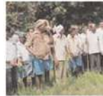
ఎండిపోతున్నాయన్నారు. విద్యుత్ మోఘాల్సను వినియోగించి నీరు కోరుకుందామంటే కరెంట్ ట్రాన్స్ఫర్ కూడా కాలిపోయి 20 రోజులు అయినా పట్టించుకోనే అధికారులు లేరు అని వాపోయారు. దీంతో రైతులు డీజిల్ ఇంజనెతో సొంత

ఖర్చులు పెట్టుకుని చేలకు నీరు పెట్టుకుంటున్నారని చెప్పారు. ఇంత జరుగుతున్నా అధికారులు పట్టించుకోకపోవడం దారుణ మన్నారు. దాదాపు పంటకు నీరు అందించలేమని ముందే ఇరిగేషన్ అధికారులు చెప్పి ఉంటే రైతులు పంటలు వేసేవారు కాదని వాపోయారు. ముఖ్యంగా కొలు రైతులు కొలు ఎలా చెల్లించాలి చెప్పిన పంటకి ఎకరానికి 30 వేలు పెట్టు బడి చెట్టి పెట్టుబడిని ఎలా రాబట్టాలి అని వాపోతున్నారు. రైతులకు సర్వీసిన సన్నాన్ని ప్రభుత్వం చెల్లించాలని డిమాండ్ చేశారు.