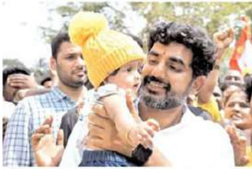
లోకేష్ సందన: టిడిపి హయాంలో యాదవులకు పెద్దపీట వేశాం!

జగన్ రెడ్డిని ప్యాక్షన్ మనస్తత్వం... యాదవులు అర్థికంగా బలపడితే తన మాట వినరు అనే ఆలోచనతోనే మీకు తీరని అన్యాయం చేశాడు. టిడిపి హయాంలో కార్పొరేషన్ ఏర్పాటు చేశాం. 300 కోట్ల రూపాయలు మీ సంక్షేమం కోసం ఖర్చు చేశాం. ఆదరణ పథకం కోసం 1000 కోట్లు ఖర్చు చేశాం. మేకలు, గొర్రెలు కొనడానికి టిడిపి ప్రభుత్వం సబ్సిడీ తీసుకువచ్చింది. ప్రతి నియోజకవర్గంలో ఇండస్ట్రియల్ క్లస్టర్ ఏర్పాటు చేసి చిన్న మధ్య తరగతి పరిశ్రమలు ఏర్పాటు చేసి జీసీఎస్