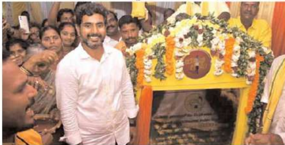
తెలుగుదేశం పార్టీ జాతీయ ప్రధాన కార్యదర్శి నారా లోకేష్ కలపెట్టిన యువగళం పాదయాత్ర శనివారం

ప్రతి అడుగు రాష్ట్రం కోసమేనని లోకేష్ ప్రకటన