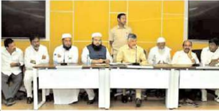
ఫరూక్ షజ్జీ చంద్రబాబుకు ఖవలించారు. మైనాలిటీ హక్కుల పరిరక్షణ సమితి ద్వారా ముస్లింల హక్కుల కోసం, రక్షణ కోసం పోరాడుతున్నాం అని, తమకు అండగా నిలవాలని టీడీపీ అధినేతను కోరారు. ఇతర రాజకీయ పార్టీల మద్దతు కూడా తీసుకుని ముస్లిం వర్గానికి అండగా నిలుస్తామని. తరువాయి 2లో

అధికార పార్టీ ప్రోద్బలంతో దాడులకు గురవుతున్న ముస్లిం వర్గానికి టీడీపీ అండగా ఉంటుందని పార్టీ అధినేత నారా చంద్రబాబు నాయుడు అన్నారు. వైసీపీ అధికారంలోకి వచ్చిన తరువాత ముస్లిం వర్గం తీవ్రంగా నష్టపోయిందని ఆయన అన్నారు. ముస్లింలను వేధిస్తున్న వైసీపీ ప్రభుత్వం ఖచ్చితంగా దానికి గట్టి మూల్యం చెల్లిస్తుందని అన్నారు. పార్టీ కేంద్ర కార్యాలయంలో చంద్రబాబు నాయుడుతో మైనాలిటీ హక్కుల పరిరక్షణ సమితి నాయకులు భేటీ అయ్యారు. రాష్ట్రంలో వైసీపీ అధికారంలోకి వచ్చిన తరువాత ముస్లింలపై దాడులు, వేధింపులు పెరిగాయని, ఇప్పటి వరకు 72 తీవ్ర స్థాయి ఘటనలు జరిగాయని మైనాలిటీ హక్కుల పరిరక్షణ సమితి అధ్యక్షులు ఎం.