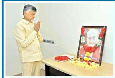
ప్రముఖ దర్శకులు, కళా తపస్వికె. విశ్వనాథ్ మరణ వార్తపై టీడీపీ అధినేత నారా చంద్రబాబు నాయుడు తీవ్ర దిగ్భ్రాంతిని వ్యక్తం చేశారు. ఆయన ఆత్మకు శాంతి చేకూరాలని దేవుడిని ప్రార్థిస్తున్నట్లు తెలిపారు. ఆయన కుటుంబ సభ్యులకు ప్రగాఢ సామఘాటించి తెలియజేశారు.