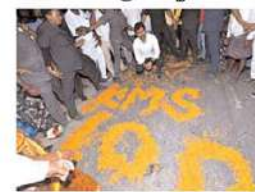
నాలుగువేల కిలోమీటర్ల పాదయాత్ర ప్రస్థానంలో తన కొలి మజిలీ ఆ ప్రాంతీయులకు తరువాయి 2లో

- కిడ్నీ వ్యాధిగ్రస్తుల కోసం డయాలసిస్ కేంద్రం ఏర్పాటు - యువగళం పాదయాత్రలో నారా లోకేష్ వేసే ప్రతి అడుగుకీ ఓ అర్థం ఉంది. ప్రతి సమస్యకు ఓ పరిష్కార మార్గం దొరుకుతోంది. ప్రతి మజిలీ ప్రజల ప్రయోజనానికే అంకితం చేయనున్నారు. యువగళంతో నారా లోకేష్ నవతరాలకి నాంది పలికారు. తన పాదయాత్ర పూతలపట్టు నియోజకవర్గం బంగారుపాళ్ళంలో వంద కిలోమీటర్ల పూర్తి చేసుకుంది.