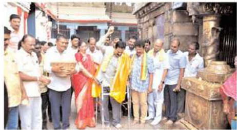
దామలూరులో కొబ్బరికాయలు కొడుతున్న దీడిపి నేతలు