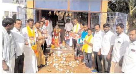
బుక్కపట్నంలో కొబ్బరికాయలు కొడుతున్న దీడిపి నాయకులు

నారా లోకేత చేపట్టిన యువగళం పాదయాత్ర విజయవంతం కావాలని తీవ్రస్థాయి జిల్లా బుక్కపట్నం మండలం యాదంబకపల్లి, కృష్ణాపురం పంచాయతీలోని సత్యమ్మ గుడిలో 111 బెంకాయలు కొట్టి ప్రత్యేక పూజలు నిర్వహించారు. ఈ సందర్భంగా దీడిపి నాయకులు మాట్లాడుతూ వైసిపి ప్రభుత్వం రాష్ట్ర ప్రజలకు సంక్షేమ పాలనను అందించడం మరిచిపోయి విద్వంసాలు, కుట్రలు, దాడులు, అక్రమ కేసులను ప్రోత్సహించడం మొదలు పెట్టిందని, రాష్ట్రవ్యాప్తంగా నిరుద్యోగ యువతకు, రైతాంగానికి, ఉద్యోగస్థులకు చేసిన దోపిడీలను, ప్రత్యేక ఆంక్షం చేయడం వనిగా పెట్టుకున్నారన్నారు. గత ప్రభుత్వం హయాంలో సామాన్యుడు సంతోషంగా ఉన్నాడని, ఒక్క అవకాశం ఇచ్చిన పాపానికి వక్క రాష్ట్రాలకు పాలిపోయి బతకాల్సిన పరిస్థితి వచ్చిందని మండిపడ్డారు. రాష్ట్రవ్యాప్తంగా దీడిపికి వస్తున్న ఆదరణను చూసి ఓర్వలేక అనవసరమైన బీజేపీ తెచ్చి కోర్టుల్లో అప్రతిష్టపాలు ఆవుతోందన్నారు. ప్రజా సమస్యలపై పోరాడటానికి, నేనున్నానంటూ భరోసా ఇవ్వడానికి లోకేత వస్తుంటే ఆర్డంకులు సృష్టించడానికి ప్రయత్నం చేయడం నిగ్గ చేతని మండిపడ్డారు. యువగళం