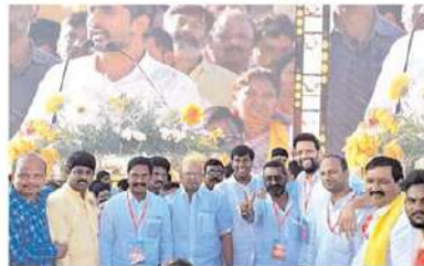
యువగళం ప్రారంభోత్సవంలో కర్నూలు దీడిపి నాయకులు