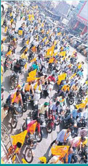
నారా లోకేష్ యువగళం పాదయాత్ర ప్రారంభించిన సందర్భంగా ఆయనకు సంఘీభావం తెలుపుతూ ఒంగోలులో టీడీపీ నేతలు భారీ బైక్ ర్యాలీ నిర్వహించారు.