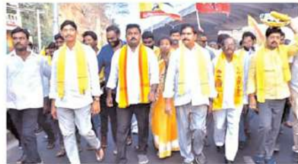
అమ్మవారికి సార, చీర ఇచ్చేందుకు పాదయాత్రా వళతను దీడిపి నేతలు