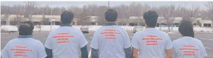
యువగళం పాదయాత్రకు మద్దతుగా ఆమెరికాలోని కాన్యాస్ కు చెందిన ఎస్టాల్డే డీడీపీ విభాగం సభ్యులు ప్రతి రోజు 5 కిలోమీటర్ల చొప్పున 400 రోజుల పాటు వాదయాత్ర చేయనున్నారు. యువగళం వాదయాత్ర 400 రోజులపాటు 4000 కిలోమీటర్లు కొనసాగునున్న విషయం తెలిసింది.