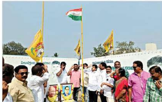
ఇస్కంట్లో ఏకత్వం, ఏకత్వంలో ఇస్కంట్.. సర్దు మానవ సాక్షాత్కం... భారత దేశమే ప్రపంచానికి ఒక కాంతి సందేశం... కృష్ణాజిల్లా తెలుగుదేశం పార్టీ కార్యాలయంలో జాతీయ జెండా వందన కార్యక్రమంలో కొన్ని రహస్య ఇతర టీడీపీ నాయకులు