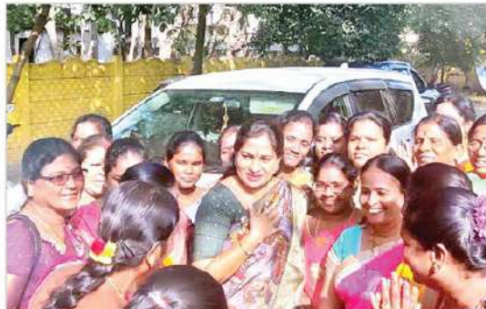
టీడీపీ జాతీయ ప్రధాన కార్యదర్శి నారా లోకేశ్ రాష్ట్ర వ్యాప్తంగా చేస్తున్న పాదయాత్రను విజయవంతం చేయాలని దిత్తూరు టీడీపీ కార్యాలయంలో జిల్లా తెలుగు మహిళా విభాగం మహిళలతో కలిసి వంగలపూడి అవత చర్చించారు.