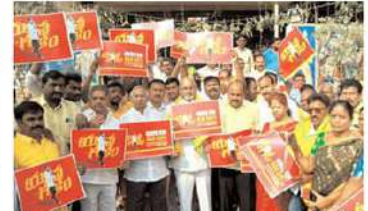
గుంటూరులో కోంమూడి నాని ఆధ్వర్యంలో..