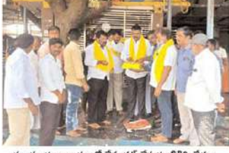
సుంకులమ్మ ఆంధ్రంలో కేకు కట్ చేస్తున్న దీడిపి నేతలు

ఘనంగా నారా లోకేశ్ జన్మదిన వేడుకలు.. పాదయాత్రలు, ర్యాలీలతో యువగళం యాత్రకు మద్దతు