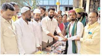
అనంతపురంలో ముఖ్యమంత్రి నిత్యావసర వస్తువుల పంపిణీ