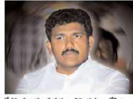
చేస్తోందన్నారు. ప్రభుత్వం ఎన్ని కుట్రలు చేసినా, యువగళం పాదయాత్ర నిర్వహించే సాగుతుందని తెలిపారు.