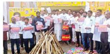
భీమిలి డిడిపి కార్యాలయం ఎదుట దిష్టిబొమ్మను దహనం చేసిన డిడిపి నాయకులు