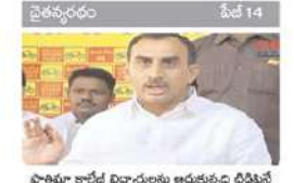
ఫొటోమా కాలేజ్ విద్యార్థులను ఆదుతున్న టిడిపి