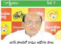
అగస్ పాలలో రాష్ట్రం అభివృద్ధి పాల

రూమ్స్ రూ. 2200లు చేశారు. సైపర్ కాటేజిలో ఉన్న వనతి గృహాల అద్దెను రూ. 750 నుంచి రూ.2800లుగా పెంచారు.భక్తుల గదుల అద్దెలతో పాటు డిపాజిట్ను అంతే మొత్తంలో చెల్లించాల్సి ఉంటుంది. గదిని రూ.1700లకు తీసుకుంటే డిపాజిట్ రూ.3400లు చెల్లించాల్సి ఉంటుంది. వనతి గృహాల అద్దెలను భారీగా పెంచడం పట్ల భక్తులు ఆందోళన వ్యక్తం చేస్తున్నారు.