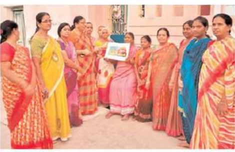
టిడిపి మహిళా నేతల ఆధ్వర్యంలో చిలకలూరిపేటలో నిర్వహించిన 'మాటామంతి' కార్యక్రమంలో స్థానికుల సమస్యలు అడిగి తెలుసుకున్న ప్రదార కరపత్రాలు పంపిణీ చేస్తున్న దృశ్యం

సందర్భంగా మహిళా నేతలు మాట్లాడుతూ జగన్ పాలనలో మద్యం ఏరులై పారుతోందని, మద్యం కారణంగా ఆడవారిపై దారులు పెరుగుతున్నాయన్నారు. జగన్ పాలన అంతానికి మహిళలంతా పిడికిలి బిగించి శపథం చేయాలని కోరారు. జగన్, ప్రజల బాగోగుల గురించి పట్టించుకోవడం లేదన్నారు. జగన్ ఇచ్చిన హామీలో ఒక్క హామీ అయినా నెరవేర్చాడా? అని ప్రశ్నించారు. పిడికిలి బిగించి మహిళలంతా మహిళల పంతం జగన్ పాలన అంతం అంటూ పోరాడాలని చిలకలూరిపేట నియోజకవర్గ మహిళా నేతలు పిలుపునిచ్చారు.