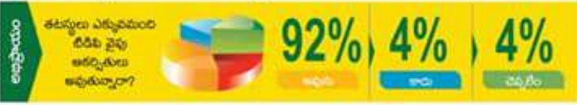
దేవతీ ప్రకృతి : ప్రభుత్వం తాతగా జారీ చేసిన జీవో రంధ్రలను పథకం అధ్యక్షోపచారణా?