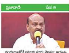
చంద్రబాబుతోనే బీజేపీకి పూర్వ ప్రధానం అయ్యారు.