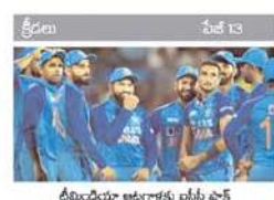
దీమిడియా అడుగులకు చిట్ల ఎన్