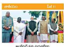
అంతర్గత కృషి మధువరం