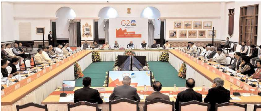
ఢిల్లీలో రాష్ట్రపతి భవన్ లో సోమవారం ప్రధాని నరేంద్ర మోడీ అధ్యక్షతన జే 20 సదస్సుపై జరిగిన అఖిలపక్ష సమావేశం