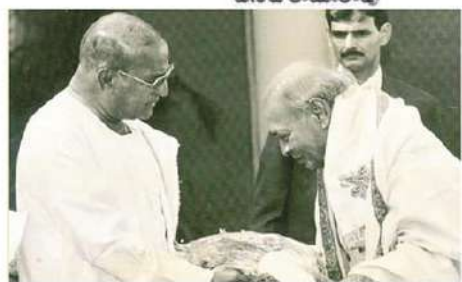
ప్రధాని పీవీకీ స్వాగతం పలుకుతున్న తెలుగుదేశం పార్టీ వ్యవస్థాపకుడు ఎన్ టి రామారావు