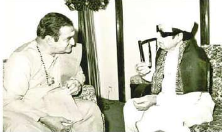
తమిళనాడు మాజీ ముఖ్యమంత్రి ఎమ్ జి రామచంద్రన్ తో తెలుగుదేశం పార్టీ వ్యవస్థాపకుడు ఎన్ టి రామారావు