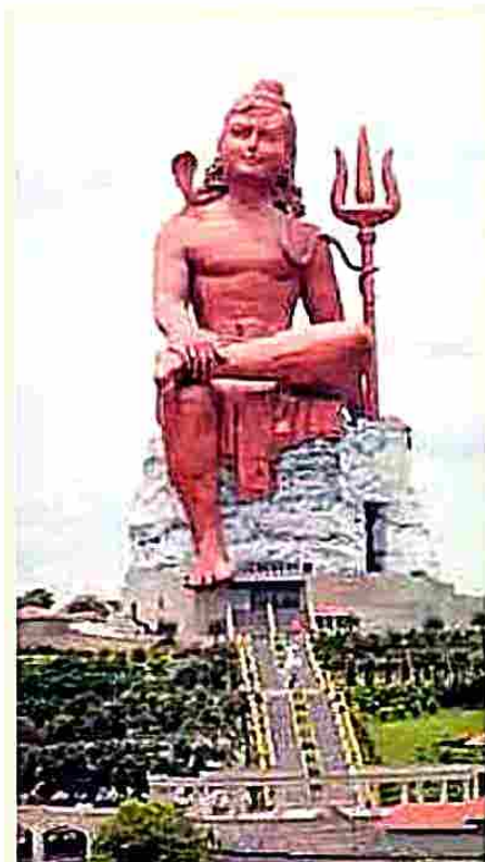
ప్రపంచంలోనే అత్యంత ఎత్తైన శివుని విగ్రహం