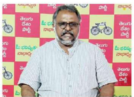
ఛేదీపై విమర్శించే నైతిక హక్కు ఉందా అని నాగబాబు ప్రశ్నించారు.