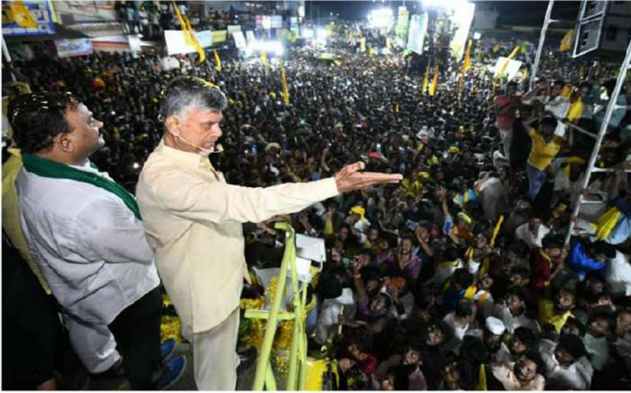
(చైతన్యరథం ప్రత్యేక ప్రతినది - నర్సరావుపేట)

జగన్ రెడ్డి పాలనలో రాష్ట్రంలో రైతులంతా నాశన మయ్యారని తెలుగుదేశంపార్టీ అధినేత చంద్రబాబు నాయుడు తీవ్రస్థాయిలో విరుచుకుపడ్డారు. జిల్లాలో పరద ప్రభావిత ప్రాంతాలలో దెబ్బతిన్న పంట పొలాలను పరిశీలించేందుకు తెలుగుదేశం పార్టీ అధినేత చంద్రబాబునాయుడు బుధవారం పల్నాడులో పర్యటించారు. చిలకలూరిపేట నియోజకవర్గం నాదెండ్ల, తూబాడు, నరసరావుపేట పల్నాడు రోడ్డు, రావిపాడు, నకిరేకల్లు మండలం కొండమోడు, పిడుగురాళ్లు, దాచేపల్లి, ప్రాంతాల్లో చంద్రబాబునాయుడు సుడిగాలి పర్యటన చేశారు. అధిక వర్షాలతో తమకు జరిగిన నష్టాన్ని రైతులు చంద్రబాబుకు వివరించారు. పల్నాడు జిల్లాగా ఏర్పడిన తర్వాత తొలిసారిగా విచ్చేసిన జనం బ్రహ్మరథం పట్టారు. ఈ సందర్భంగా చంద్రబాబునాయుడు మాట్లాడుతూ... అధిక వర్షాలకు రైతులు తీవ్రంగా నష్టపోయారు. ప్రతి పంటను పరిశీలించాను. పంట మొత్తం వర్షాలకు దెబ్బతింది. భారీ వర్షాలకు ప్రత్తి, మిరప రైతులు తీవ్రంగా నష్టపోయారు. పల్నాడు జిల్లాలో 2.52 లక్షల ఎకరాల్లో ప్రత్తి, 1.50 లక్షల ఎకరాల్లో మిరప పంటల సాగు ఉంది. మిరప, ప్రత్తి పంటలకు ఇప్పటికే ఎకరానికి 50 వేల నుంచి లక్ష రూపాయల వరకు ఖర్చు పెట్టారు. తాదేపల్లి ప్యాలెస్ లో ఉన్న ముఖ్యమంత్రికి ఈ పంట నష్టం పట్టడం లేదా? అసత్యాలు చెప్పడంలో జగన్ దిట్ట... రైతులను అదుకోవాలనే ఆలోచన జగన్ కు లేదు. ప్యాలెస్ లో కూర్చుని కులకదానికి కాదు మీరు సిఎం అయ్యింది? రైతులకు ఇంత నష్టం జరిగితే అధికారులుగాని, ఎమ్మెల్యే గాని రాలేదని అన్నారు.