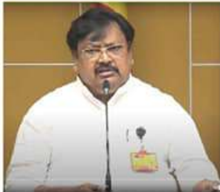
అధికారుల్ని భయపెట్టే స్థాయికి రాష్ట్ర పోలీస్ విభాగం వెళ్లడం ముద్దాయిలపై ముఖ్యమంత్రికి ఉన్న అపార ప్రేమ, అస్పృహను దాగాలకు నిరర్థకం కాదా?

రాష్ట్రంలో పరిపాలన చూస్తుంటే, అమీందారులు, రాజులు, చక్రవర్తుల పాలన గుర్తుకొస్తోంది. అమీందారీ పాలనాపోకడలు, పెత్తందారీ వ్యవస్థపాద అగన్ రెడ్డి పరిపాలనలో కొట్టొచ్చినట్లు కనిపిస్తున్నాయి. ఒక వ్యవస్థ మరో వ్యవస్థపై దాడిచేయడం, ప్రభుత్వ వ్యవస్థలు పోటీతత్వంతో వ్యవహరించడమనేది ఈ రాష్ట్రంలోనే చూస్తున్నాం. ఇలాంటి పోకడలు చాలా బాధాకరం. పోలీస్ వెర్సస్ సీబీఐ, సీబీఐ వెర్సస్ పోలీస్ అన్నట్లుగా పరిస్థితి తయారైంది. బాబాయ్ ని చంపిన వారిని పట్టుకోలేని అగన్ రెడ్డి అసమర్థపాలనకు నాయకుడు కాదా? రాష్ట్ర డీటీపీ ఏనాడైనా వివేక హత్య కేసు విచారణ ఎడతలలో ఉందని సమక్ష చేశారా? సీబీఐ