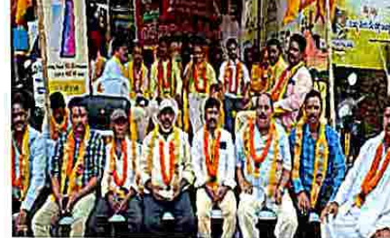
పలాస (చైతన్యరథం) అక్టోబర్ 3 : నందమూరి తారకరామారావు వైద్య విశ్వవిద్యాలయ పేరును కుట్రపూరితంగా తొలగించి ముఖ్యమంత్రి జగన్ తన

● పలాసలో టీడీపీ శ్రేణులు రిలే నిరాహార దీక్ష