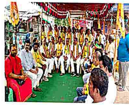
నరసన్నపేట (చైతన్యరథం) అక్టోబర్ 3 : ఎన్టీఆర్