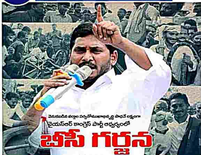
వెనుకబడిన వర్గాల వ్యవస్థాపక పాత్ర లక్షణంగా చైరమనూరి కాంగ్రెస్ పార్టీ రివ్యూలో బీసీ గర్జన