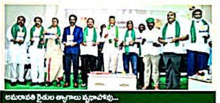
అమరావతి రైతుల అగ్గాలు వ్యూహాచార్యు...