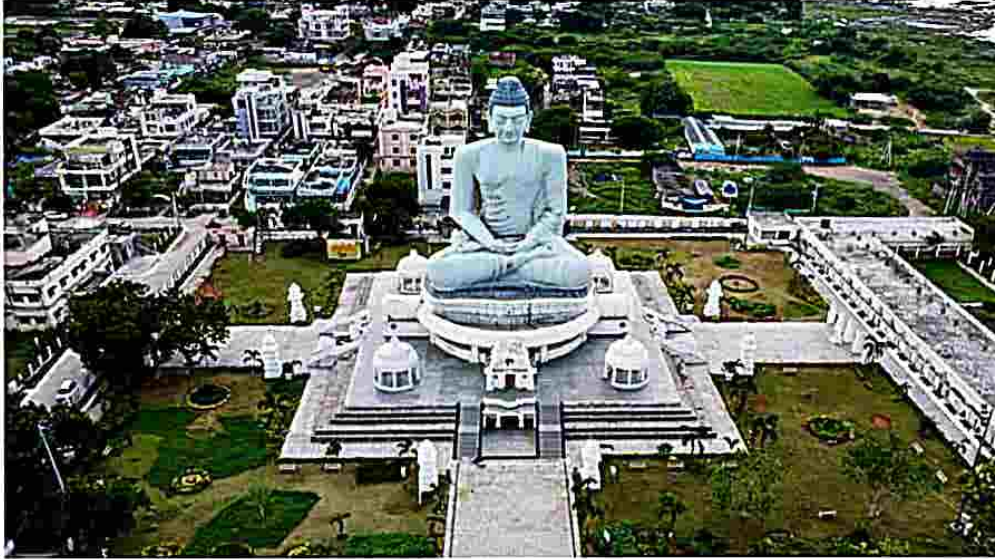
(చైతన్యరథం ప్రత్యేక ప్రతినిధి - అమరావతి)

◆ ఈనెల 27న కేంద్ర హెమాంశాఖ సమావేశం ◆ 3రాజధానులను ప్రస్తావించని కేంద్ర హెమాంశాఖ