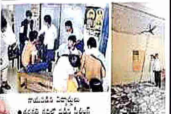
గాయపడిన విద్యార్థులు • తరగతి గదిలో వదిలి వేయబడ్డారు

| డ్రైల్ల పనులు చేసి, డబ్బులు ఖుంగేస్తారా?