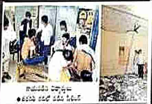
గాయపడిన విద్యార్థులు • తరగతి గదిలో వదిలి వేయబడ్డారు