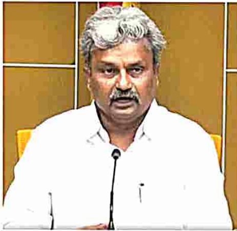
వ్యవస్థలను బ్రష్టుపట్టించిన జగన్ రెడ్డి!