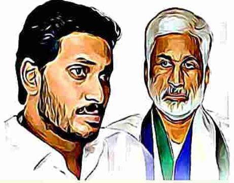
జగన్ రెడ్డి అభివృద్ధికాముకుడు కాదు..

ఉత్తరాంధ్రపై ప్రేమను వలకబోస్తున్న జగన్ రెడ్డి ఉత్తరాంధ్రకు జీవనాధారమైన “ఉత్తరాంధ్ర-సుజల ప్రవంతి”ని ఎందుకు పూర్తిచేయలేదో అక్కడి ప్రజలకు సమాధానం చెప్పాలి. మూడు రాజధానులతోనే అభివృద్ధి అని చెప్పే జగన్ రెడ్డి ఏపీకి జీవనాడి అయిన పోలవరాన్ని వరదల్లో ముంచి ఎందుకు నాశనం చేస్తున్నారో యావత్ రాష్ట్ర ప్రజలకు సమాధానం చెప్పాలి. విశాఖ రైల్వే జోన్ ను తీసుకురావడానికి ఈ మూడేళ్లలో ఎందుకు ప్రయత్నం చేయలేదు? విశాఖ స్టీల్ ప్లాంట్ ను అమ్మడానికి కేంద్రానికి ఎందుకు సహకరించారు? విశాఖ నుండి లులు వంటి పెట్టుబడిదారులను ఎందుకు తరిమేశారు? ఉత్తరాంధ్ర, రాయల సీమలో వెనుకబడిన ప్రాంతాల అభివృద్ధికి కేంద్రం ఇవ్వాలిని నిధులను తీసుకురావడం కోసం ఇప్పటి వరకు ఎందుకు ప్రయత్నం చేయలేదు? ఏపీకి కేంద్రం నుండి విభజన చట్టం ద్వారా న్యాయబద్ధంగా రావాల్సిన హామీలను సాధించడం కోసం కేంద్రాన్ని ఎందుకు నిలదీయలేకపోతున్నారు? భోగాపురం ఎయిర్ పోర్టు, గిరిజన విశ్వవిద్యాలయాలను ఇప్పటికే పూర్తిచేయాల్సి ఉంది, ఎందుకు పూర్తిచేయలేదు? ఇవన్నీచేయం కూడా అప్పుల కోసం ప్రభుత్వ కార్యాలయాలను తాకట్టు పెడుతున్నారు. రుషి కొండను కట్టా చేయడానికి చట్టాల అతిక్రమిస్తూ పర్యావరణాన్ని ధ్వంసం చేస్తున్నారు. పేద, మధ్య తరగతి వర్గాల అసైన్డ్ భూములు 11వేల ఎకరాలు బలవంతంగా దోచుకున్నారు. తిరగబడిన వారిపై రౌడీయజాన్ని చెలాయిస్తున్నారు. ఇవన్నీ అభివృద్ధి చేసేవాడి లక్షణాలా? దోచుకునేవాడి లక్షణాలా? చైతన్యవంతులైన రాష్ట్ర ప్రజలు అన్నీగమనిస్తూనే ఉన్నారు.